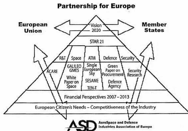
Schéma 1: Vztahy mezi klíčovými aktivitami a zájmy ASD.