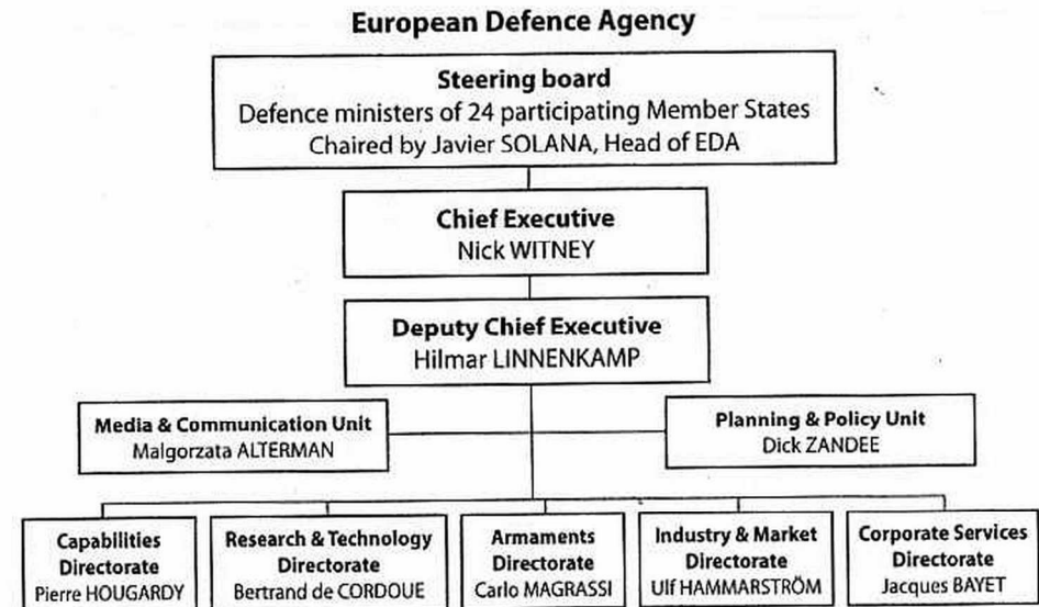
Schéma 1: Struktura EDA