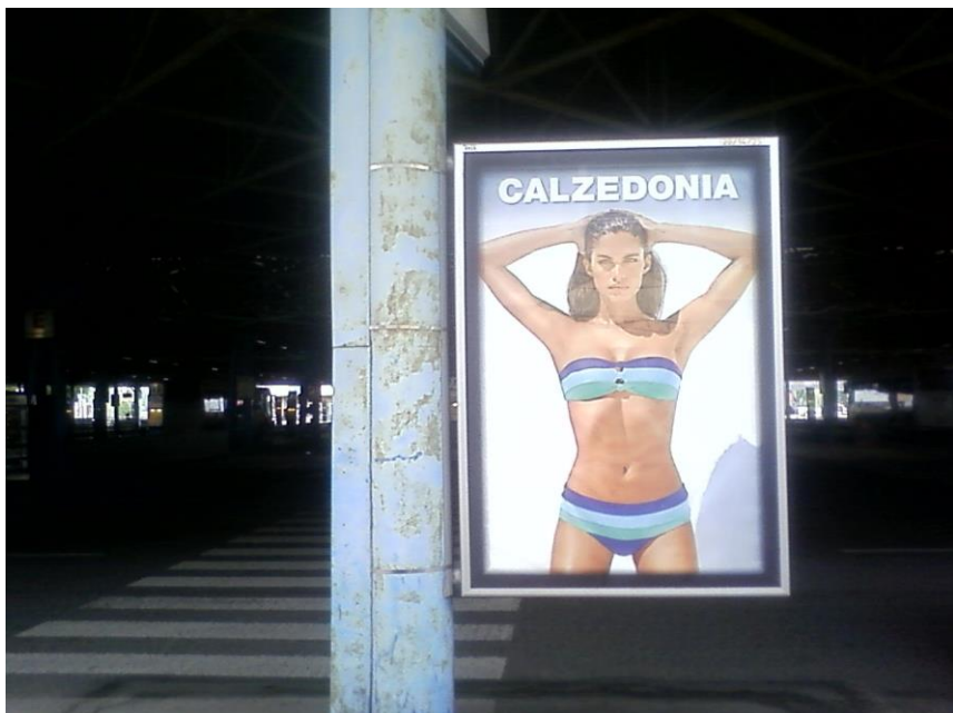
B: Reklamní postery na rezivějících podpůrných pilířích.