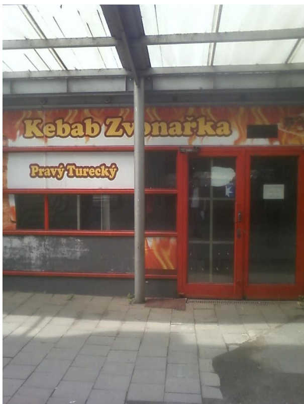
D: Vyklizený stánek.