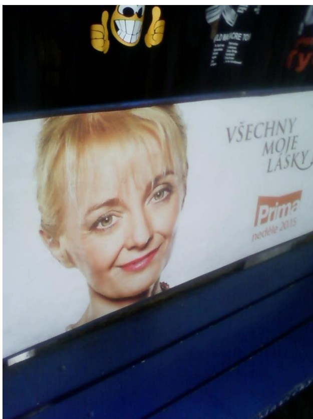
C: Lavička před nástupištěm č. 42.