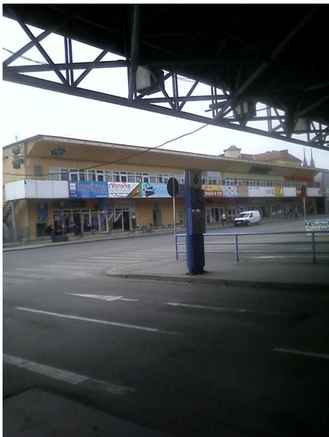
E: Ukázka prostředí autobusáku.