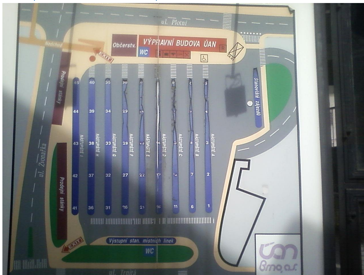
A: Plán autobusového nádraží.