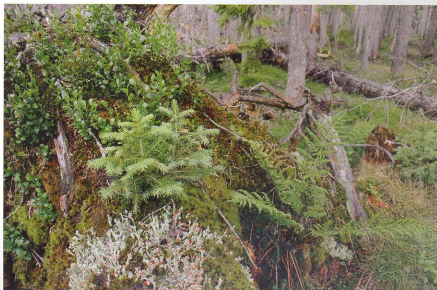
Stromy, které nikdo nesází.