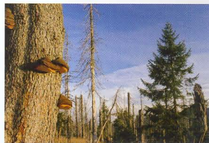
Stromy, které nikdo nekácí.