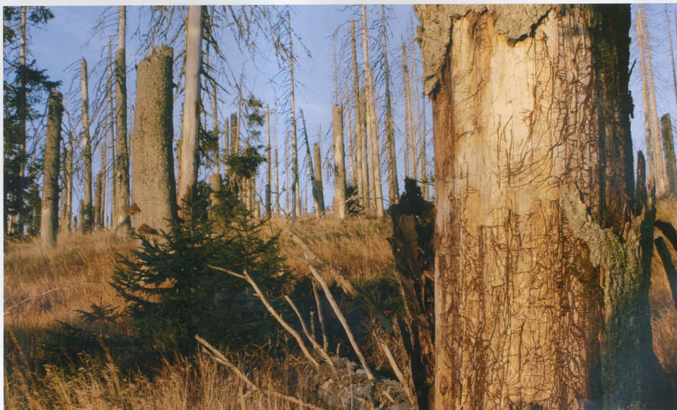
Divočina má mnoho podob: někdy mrtví převažují na živými, aby se za nějaký čas karta obrátila.

a primitivností. Jako v prvním případě, jde o jev individu nebezpečný, neboť uvolněné pudy a animálnost mohou