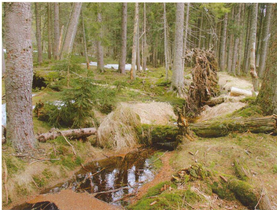
Stromy, které žijí v harmonii.

zabít, poškodit či zranit. Tím se i tato společenská divočina řadí mezi jevy nekulturní a nebezpečné, ale vzrušující, riskantní a vysoce potentní, protože pouze vyhocené okamžiky přinášejí významné plody. Divočinu můžeme tedy charakterizovat jako prostředí, které není kontrolováno společenskými pravidly, ve kterém hlavní roli hraje přirozenost, pudovost a také zákonitost chaosu. Je nevypočitatelná, riskantní, ale nesmírně stabilní.