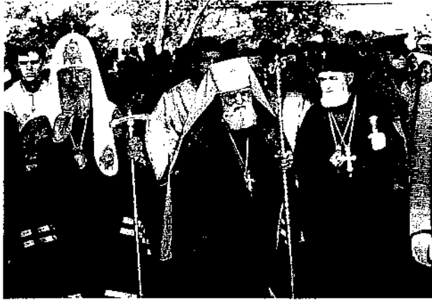
Návšteva hlavy Ruskej pravoslávnej cirkvi patriarchu Moskovského a celého Ruska Alexija II. na Slovensku, Bratislava 19.5.1996.

príslušníkom upierať právo, aby spolu s ostatnými príslušníkmi menšiny užívali svoju vlastnú kultúru, vyznávali a prejavovali svoje vlastné náboženstvo alebo používali svoj vlastný jazyk".