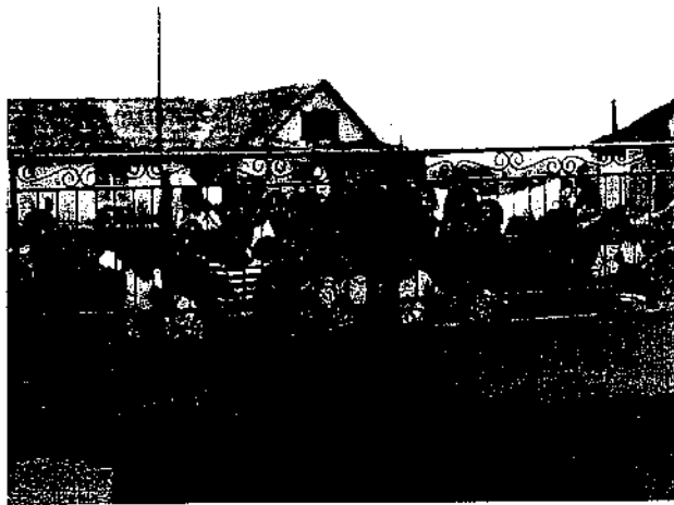
Deti z rómskej osady zaujaté fotografistom, Veľká Lomnica 1995.

Ústava Slovenskej republiky ako základný zákon štátu upravuje práva národnostných menšín a etnických skupín v časti Základné práva a slobody – v štvrtom oddiele druhej hlavy. Vychádza ako z princípu nediskriminácie, tak aj z princípu špecifických práv pre príslušníkov národnostných a etnických menšín.