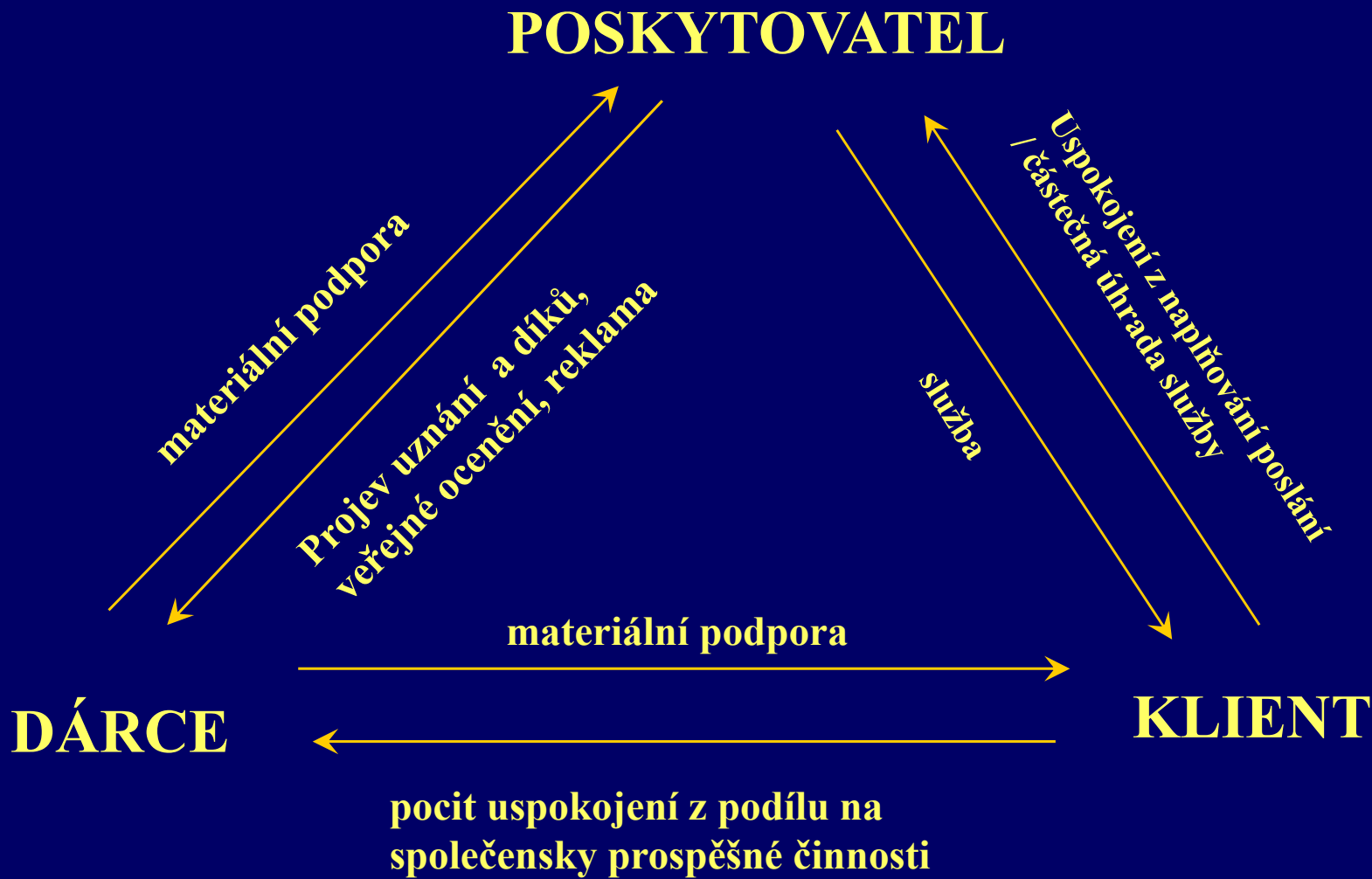
Schéma směn na neziskovém trhu