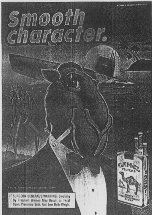
Figure A -- "Smooth Character".