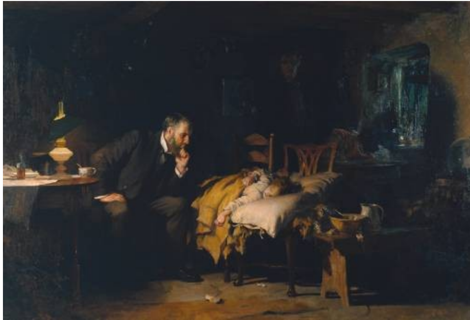
The Doctor , Luke Fildes, 1891