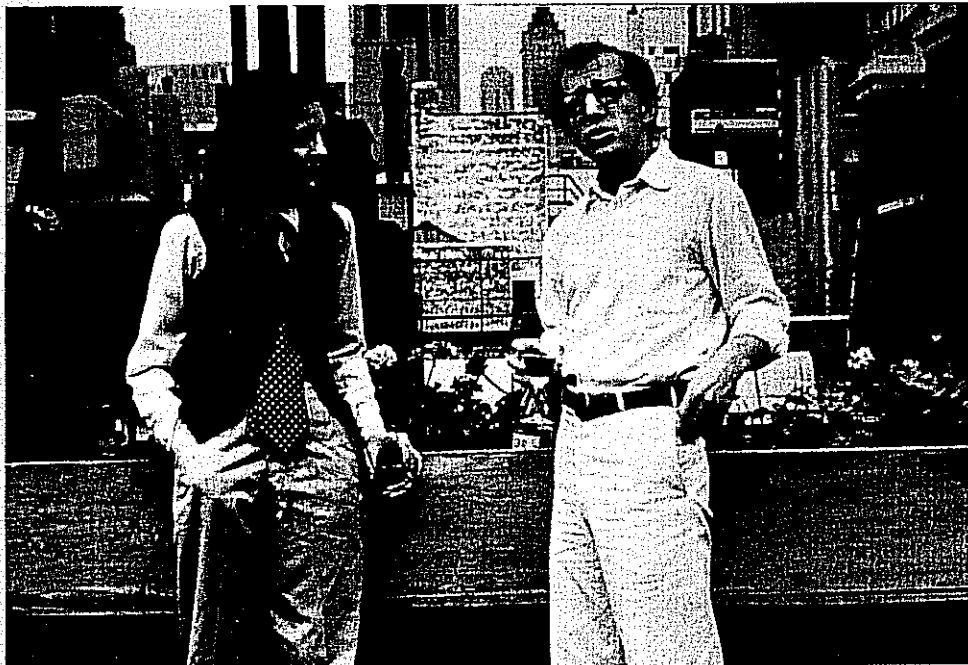
Woody Allen a Diane Keatonová ve slavném filmu Annie Hallová. Zahrál si v něm i Marshall McLuhan.

Až do nástupu elektronických médií v polovině minulého století vedl podle McLuhana tento proces k mechanickému rozdrobování původní smyslové jednoty člověka, k jeho redukci na oddělené specializované funkce.