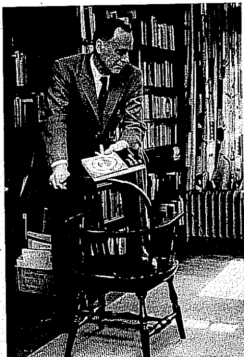
Revoluci elektronických médií hlásal v době, kterou ovládal ještě tisk

Anglická zkušenost byla rozhodující – mladý McLuhan se rozhodl studovat v Cambridge a tady se setkal s mnohem modernějším