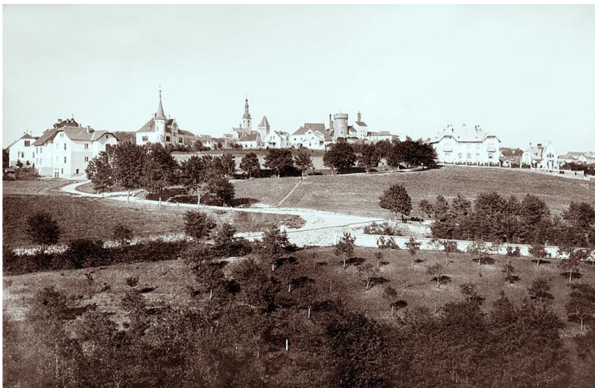
Obr.2: „Podhradí“ v Táboře (na začátku 20. století)