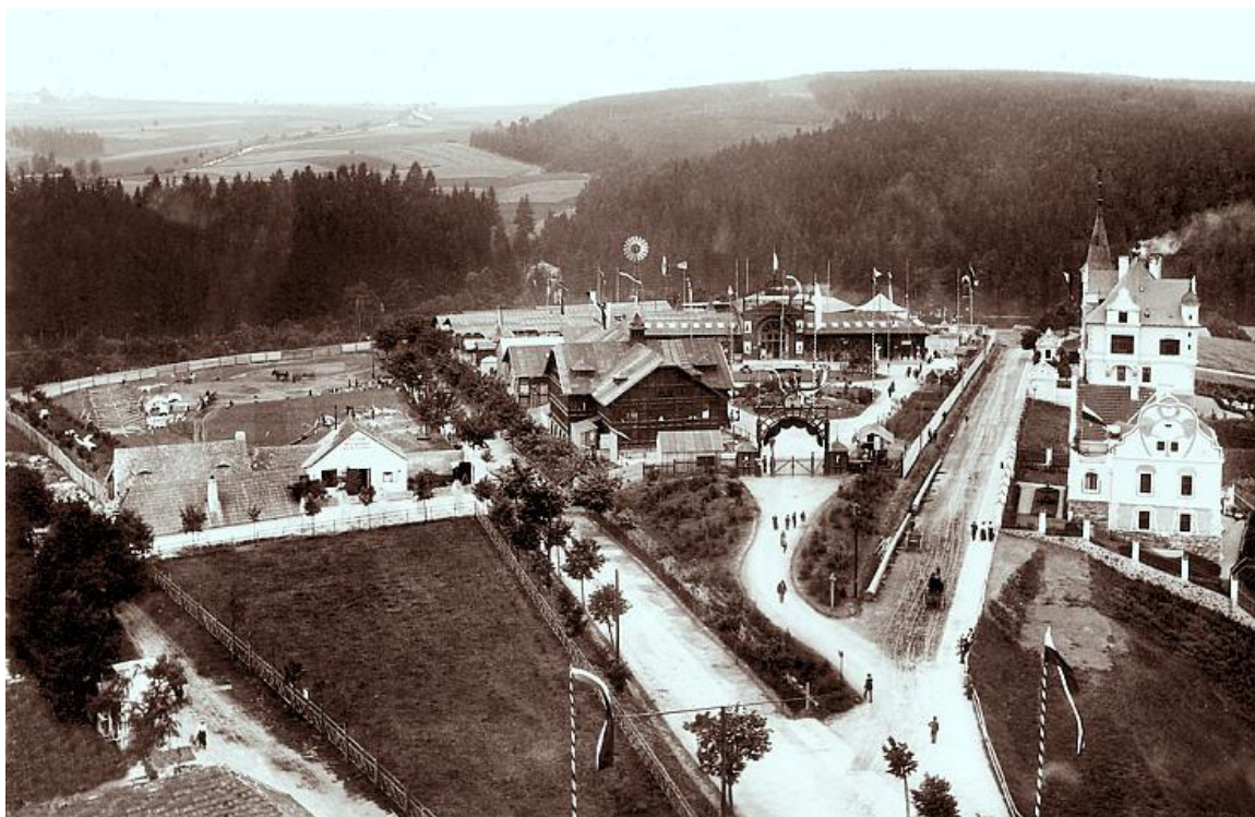
Obr.3: Výstaviště pro Jihočeskou krajinou výstavu- r. 1902 (později zde vystavěna Vilová čtvrť)