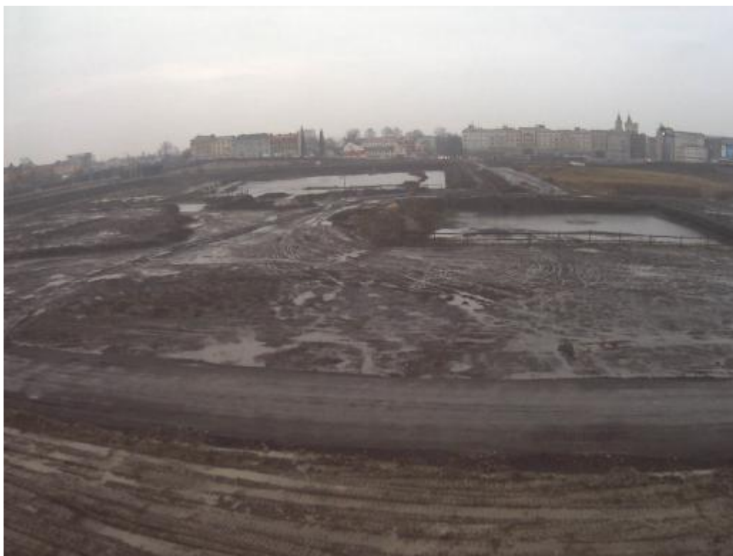
Obr.č. 2 ( http://www.ostrava.videocam.cz/ )

Současný stav lokality Karolina (13.11.2009) – pohled k městu