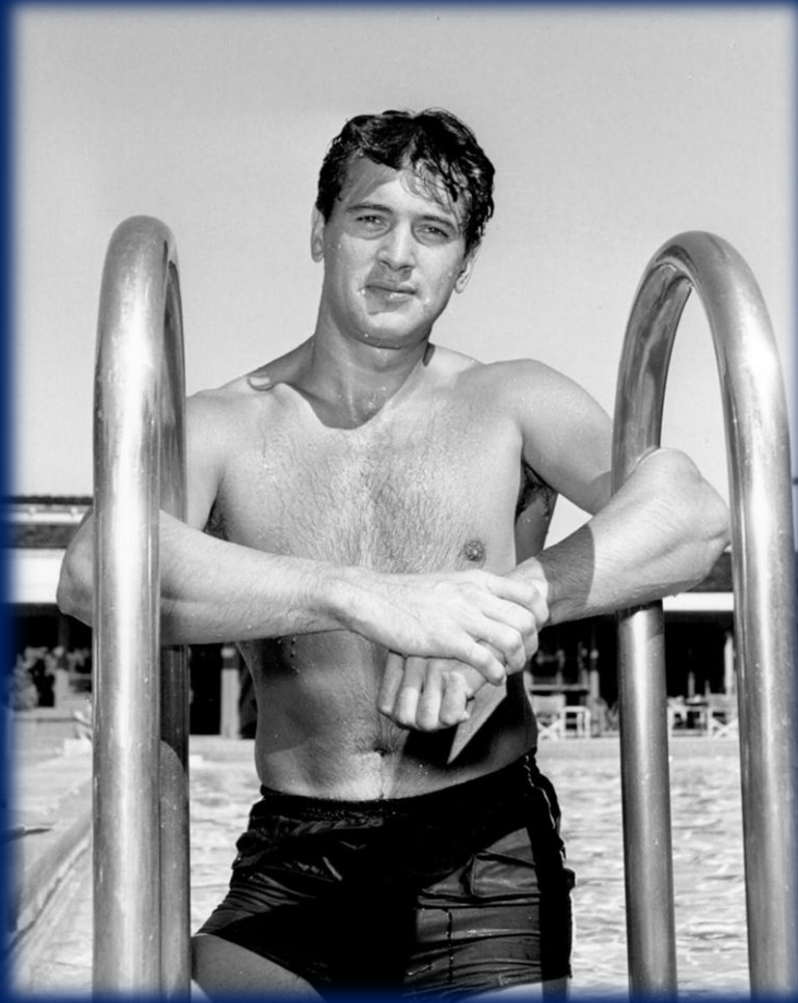
Rock Hudson (1925–1985)