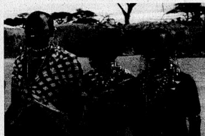
Masajské ženy z Keni - Minimálně jedna z těchto tří prošla bolestivým a nebezpečným rituálem obřízky. Důvod? Aby se vdala.

Ženská obřízka není pouze ženskou záležitostí. Celý tento rituál je vykonáván kvůli mužům. Žena obřízku podstupuje v zájmu cudnosti, protože obřízka má potlačit její sexuální touhy a znemožnit pohlavní styk – muž má zaručeno, že jeho manželka bude panna. O přístupu k obřízce svědčí i pojem ikpiko , což je termín, který v západní Nigérii označuje pohrdlivý vztah vůči neobřezaným dívkám.