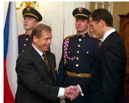
Václav Havel a Zdeněk Tůma