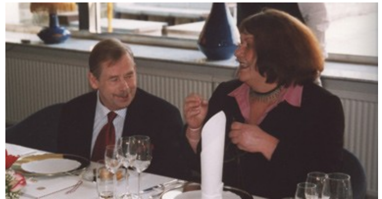
Václav Havel a Eliška Wagnerová