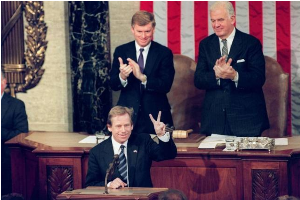
Kongres USA 2/1990