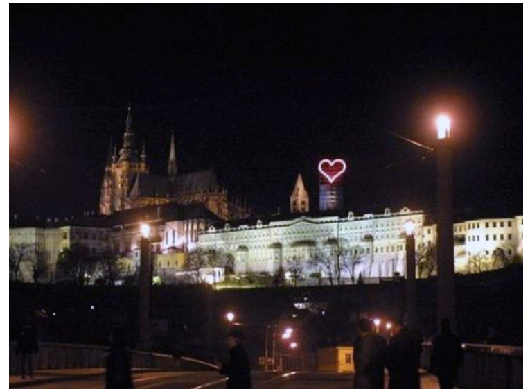
Summit NATO, ČR 11/2002