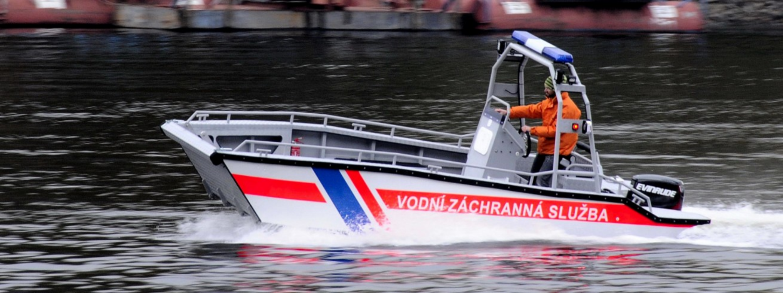
Motorový člun Multi S600