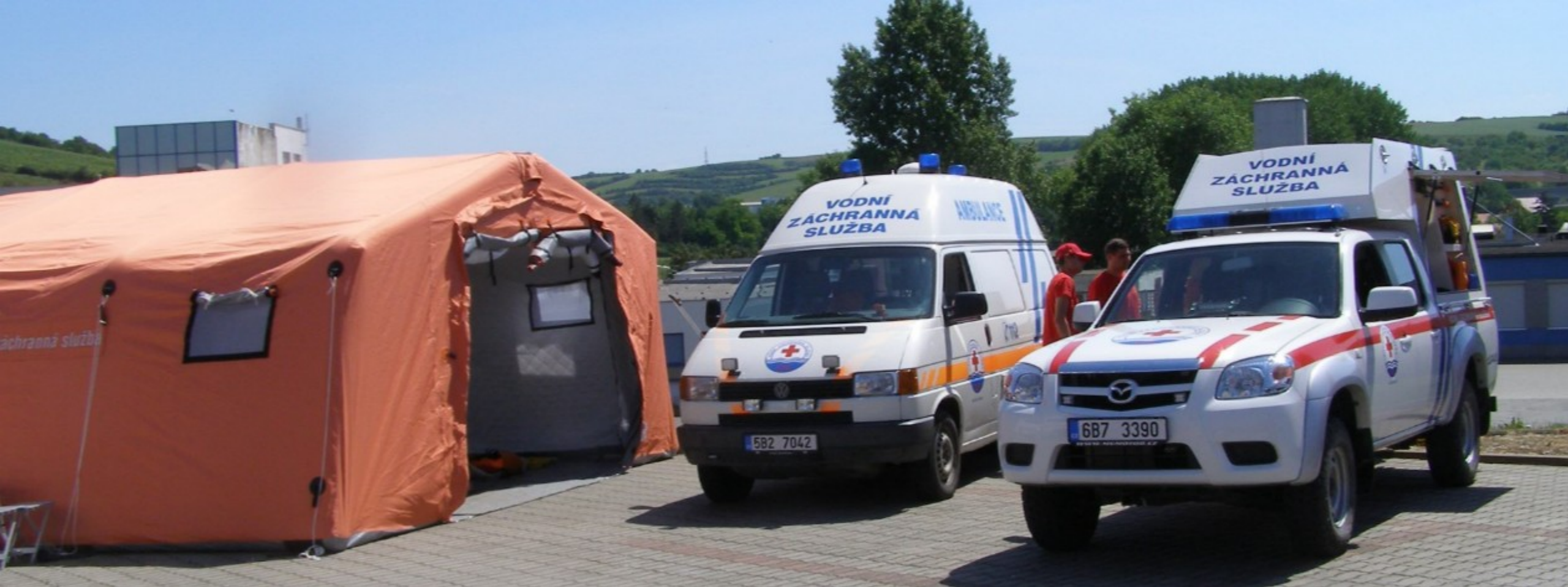
Sanitní automobil Volkswagen Transporter