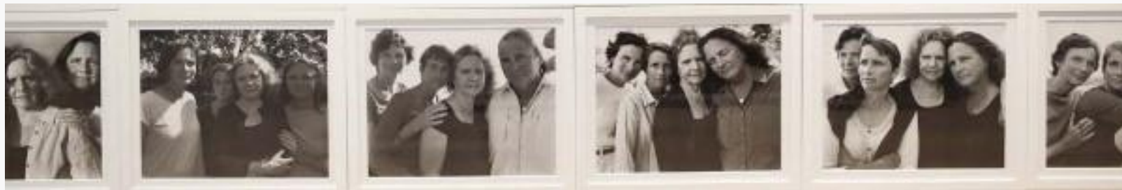
PR: Nicholas Nixon: Brown Sisters

ranné / pravé stáří - tretí vek/ štvrtý vek - later adulthood/ elderhood