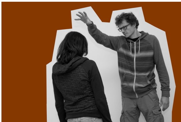
Obrázek č. 2 Divadlo obrazu – „Manipulace“