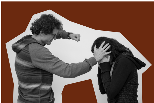
Obrázek č. 1 Divadlo obrazu – „Pěstí“