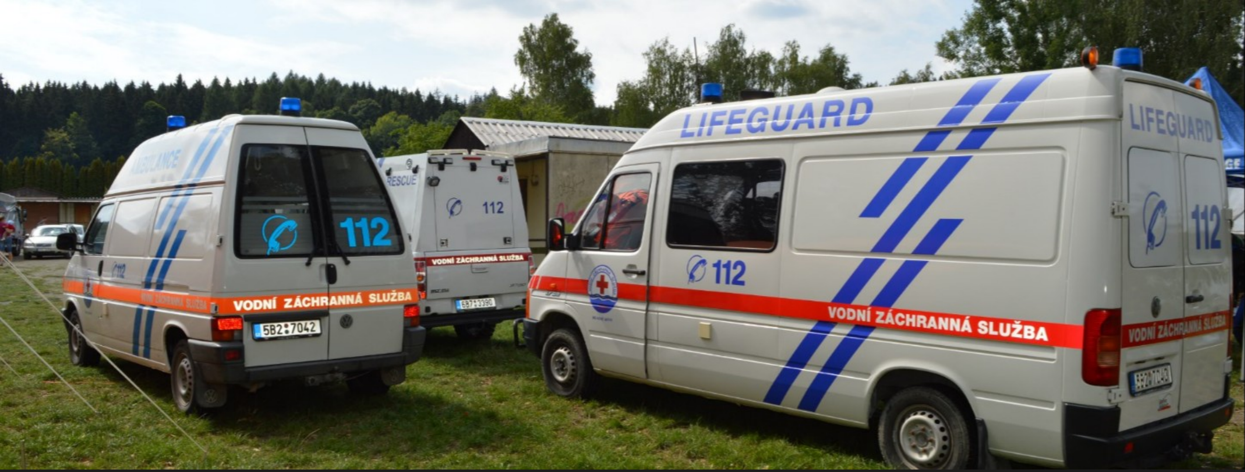
Technický automobil Volkswagen LT