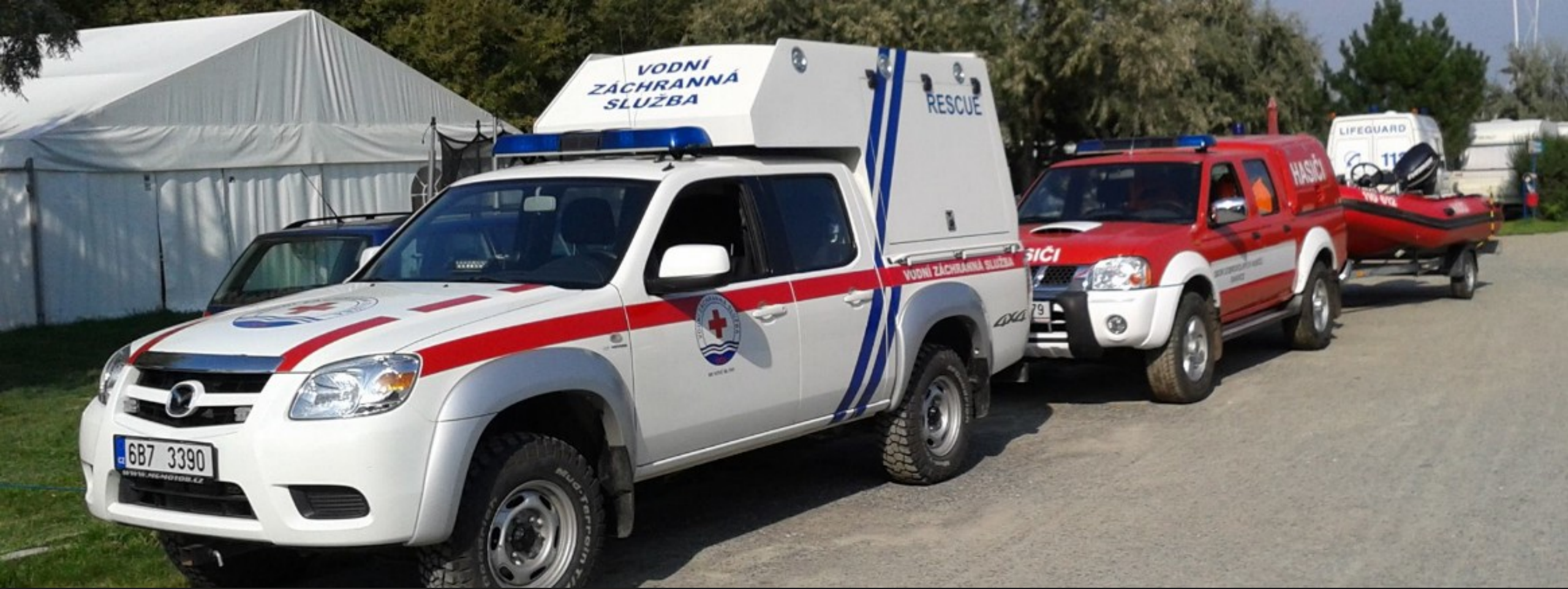
RZA Mazda BT 50