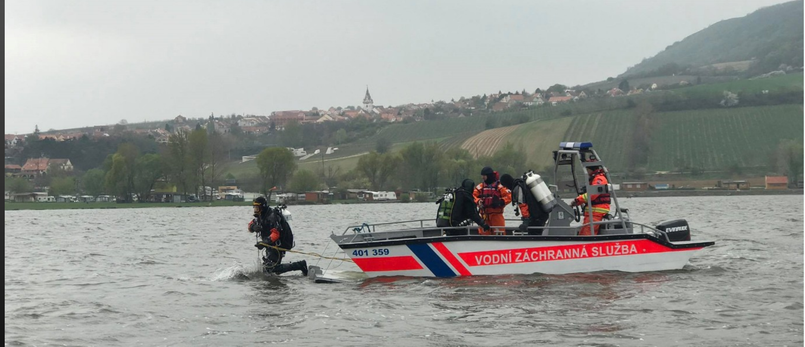
Motorový člun Multi S600