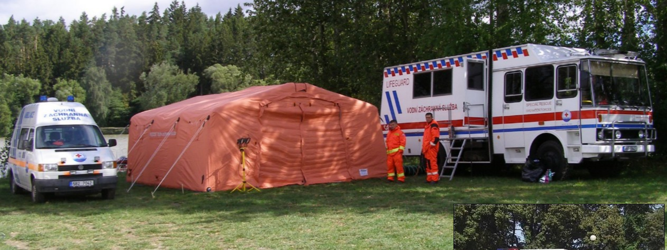
Vozidlo týlového zabezpečení LIAZ 101 4x4