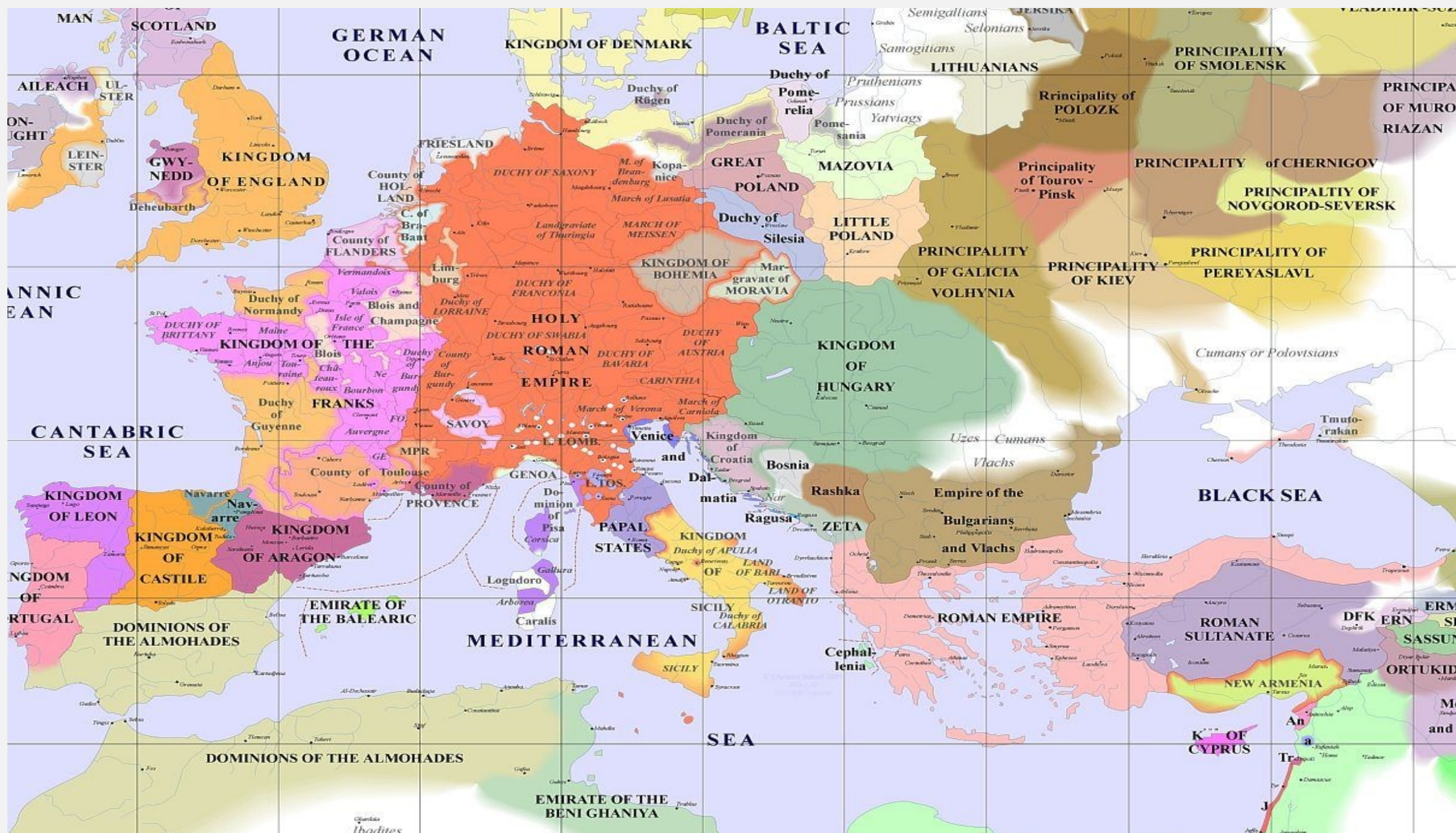
© Christos Nüssli 2001 Milieu 30, CH - 1400 Yverdon