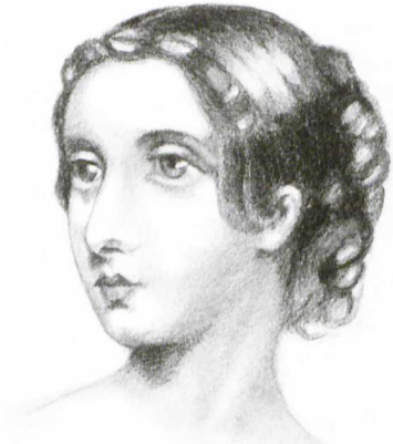
Harriet Taylorová (1807–1858)

„Zakoupil jsem domek co nejbliže místu, kde je pohřbena, a přebývám tam s její dcerou po větší část roku. Moje životní cíle nadále vycházejí z jejích. Moje současné aktivity a usilování jsou nadále ty, na kterých se podílela či s nimi sympatizovala a které jsou s ní nerozlučně spjaty... Když mají dva lidé naprosto společné myšlenky a názory, když spolu denně diskutují o intelektuálních a morálních otázkách..., není podstatné, kdo z nich drží v ruce pero... v tomto širším smyslu jsou všechny mé publikované práce stejnou mírou i jejím dílem, a její podíl na nich rostl s přibývajícím časem...“