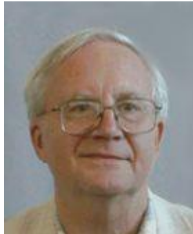
Vladimír Smékal, emeritní profesor Katedry psychologie FSS MU

Každý akt poznání nebo hodnocení, každé zaujetí stanoviska a rozhodnutí, každý prožitek a chování jsou funkcemi osobnosti a teprve znalost osobní determinace a regulace všech aktivit člověka umožňuje pochopit je. Tyto požadavky se musí stát východiskem psychologického myšlení...“