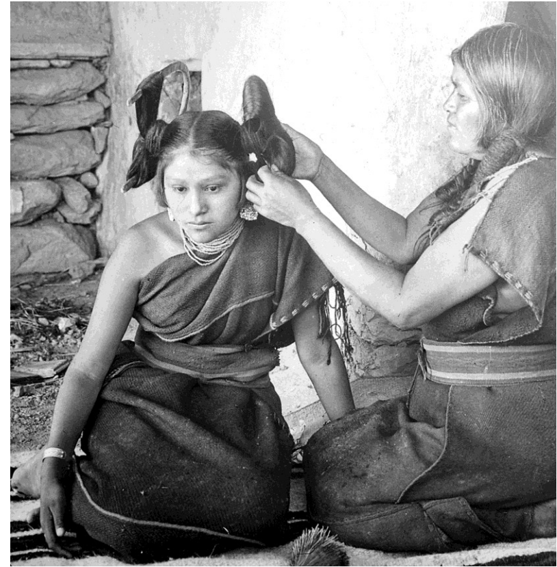
Mixe Zapotec indiáni Hopi