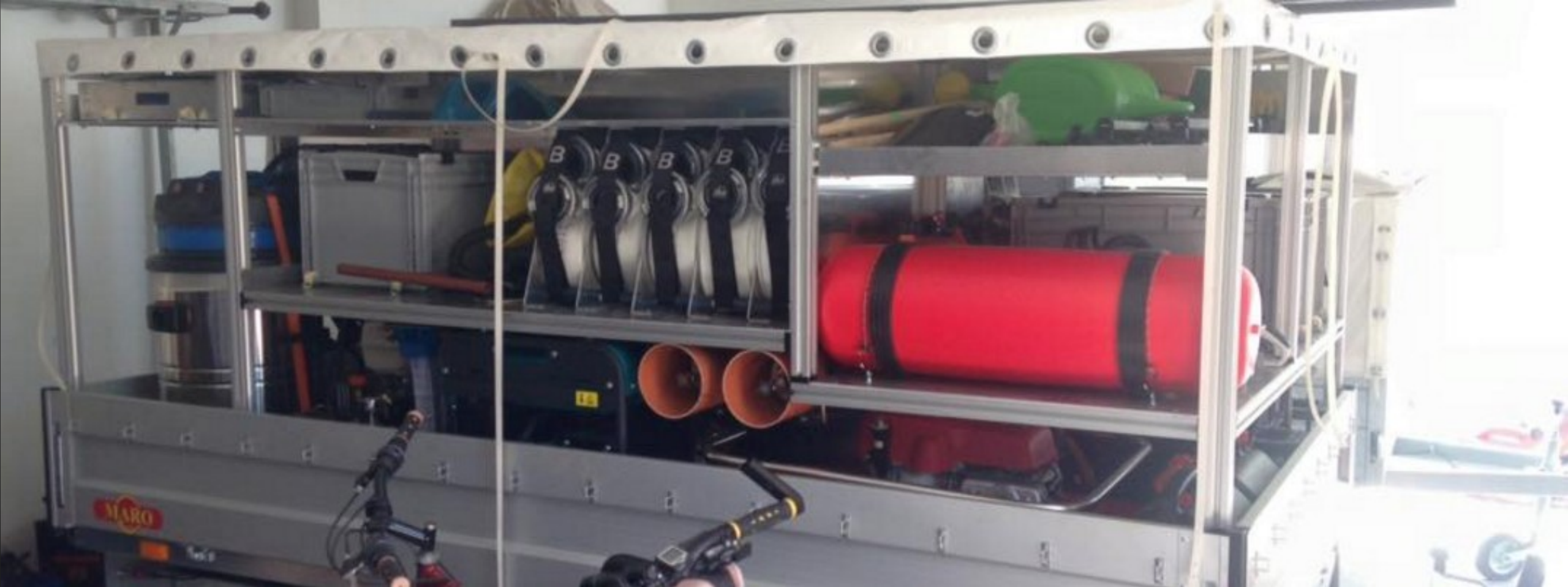
Protipovodňový a sanační přívěs