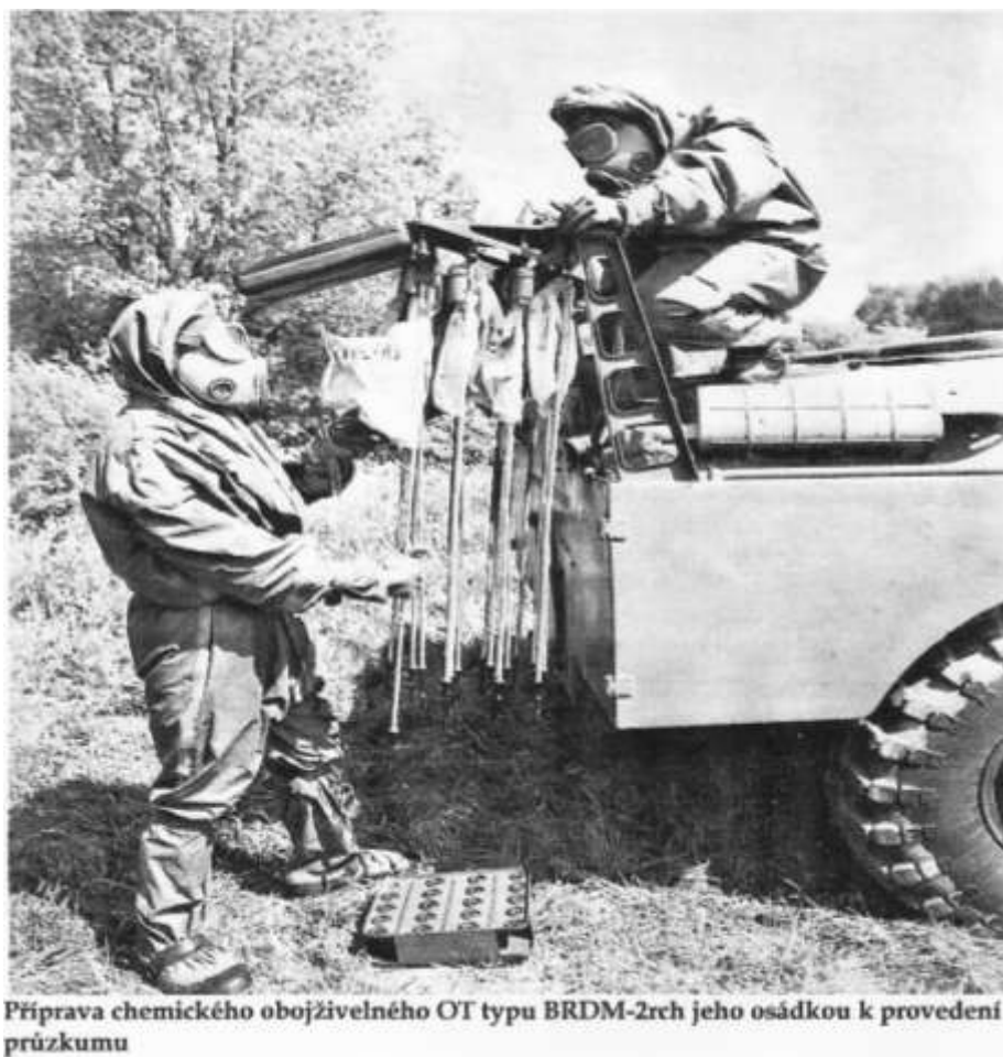
Příprava chemického obojživelného OT typu BRDM-2rch jeho osádkou k provedení průzkumu