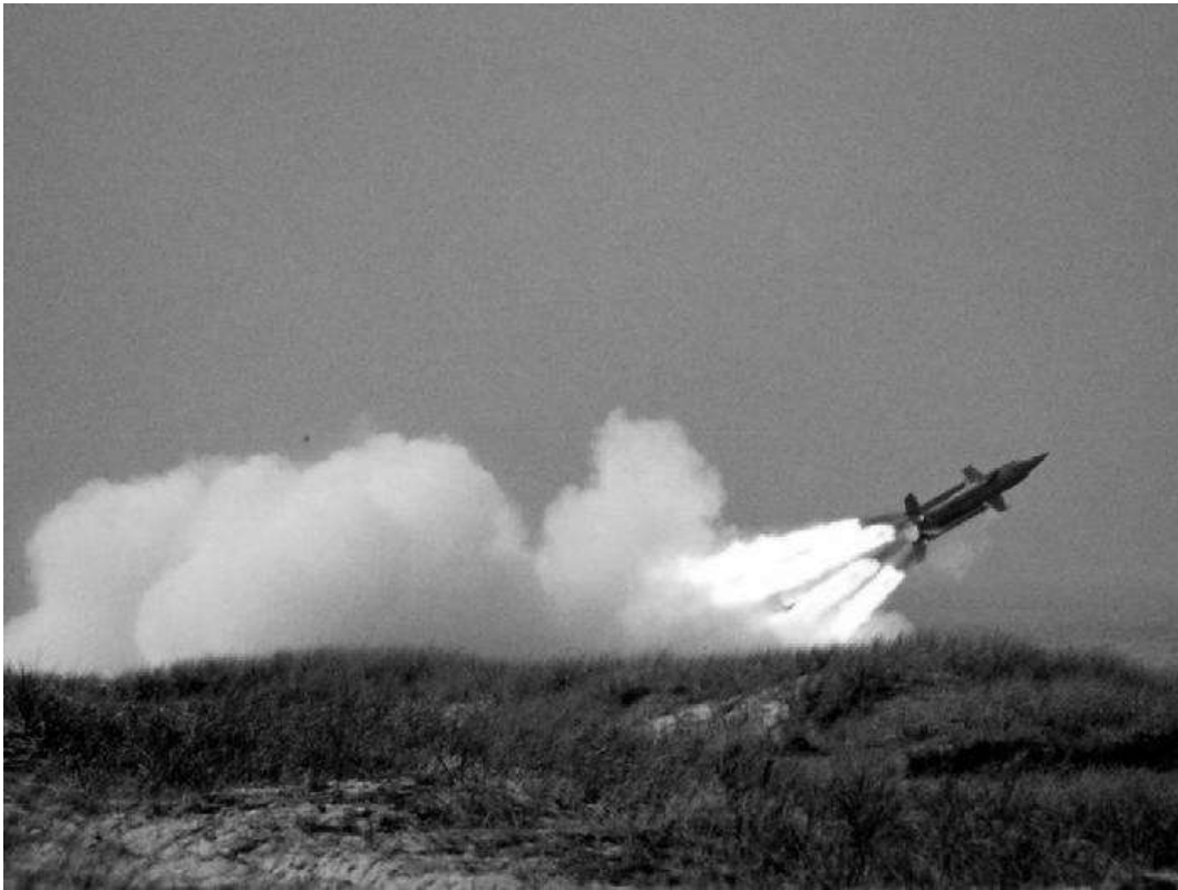
Start rakety 3M-8 protiletadlového raketového komplexu KRUG

Po návratu ze střeleb mne čekalo překvapení ve formě kádrového rozkazu, který mě, nadporučíka, ustanovoval do funkce zástupce velitele 82. protiletadlové raketové brigády. Nešlo o jiný útvar. 6. radiotechnický pluk byl reorganizován doplněním třetího oddílu na 82. protiletadlovou raketovou brigádu.