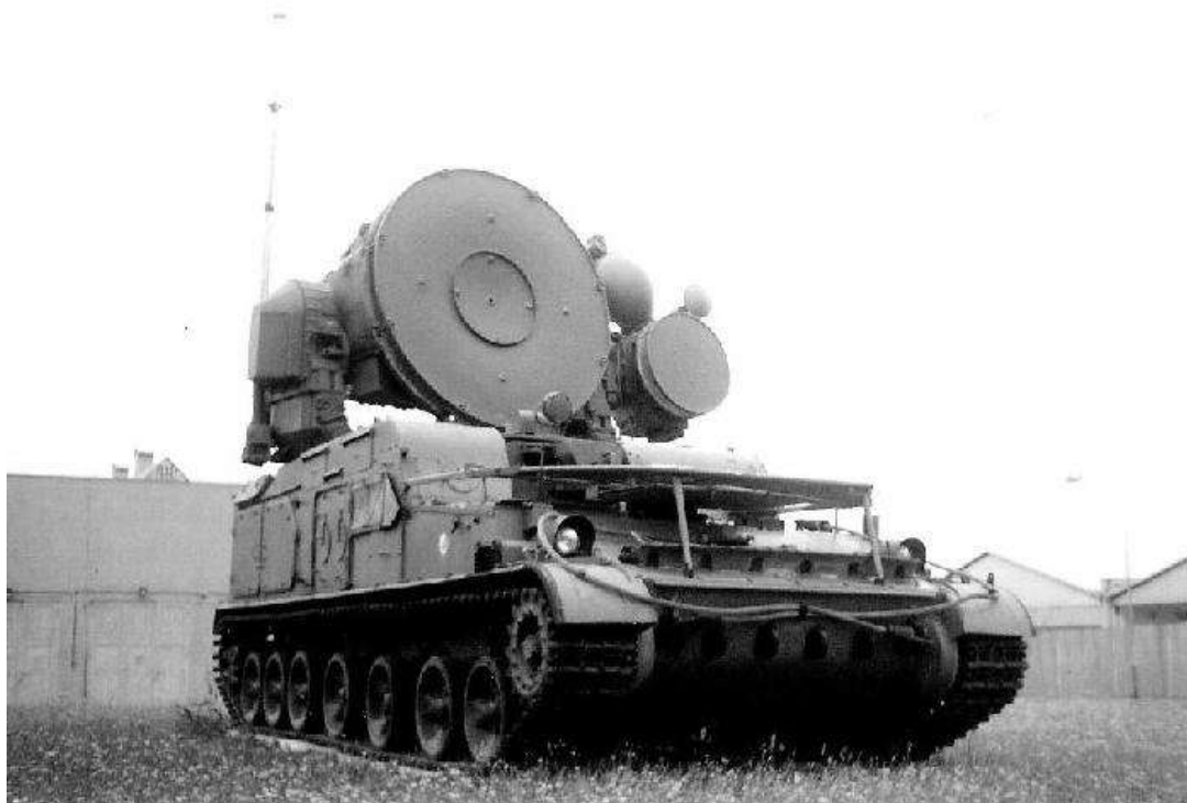
Stanice navedení raket 1S-32 protiletadlového raketového komplexu KRUG v bojové poloze

Orenburg byl v té době městem architektonicky členěným do „kamenného“ starého centra, kolem kterého byla typická ruská zástavba malovaných, někde dost zanedbaných, dřevěných obydlí. Vnější kruh tvořila nově vystavěná sídliště z vápenocementových (bílých) cihel. Samotní orenburčané byli velice přívětiví. Především cizince zkoumali se zaujetím. Do těchto končin se totiž mnoho cizinců nedostalo, proto se k nim chovali zdvořile.