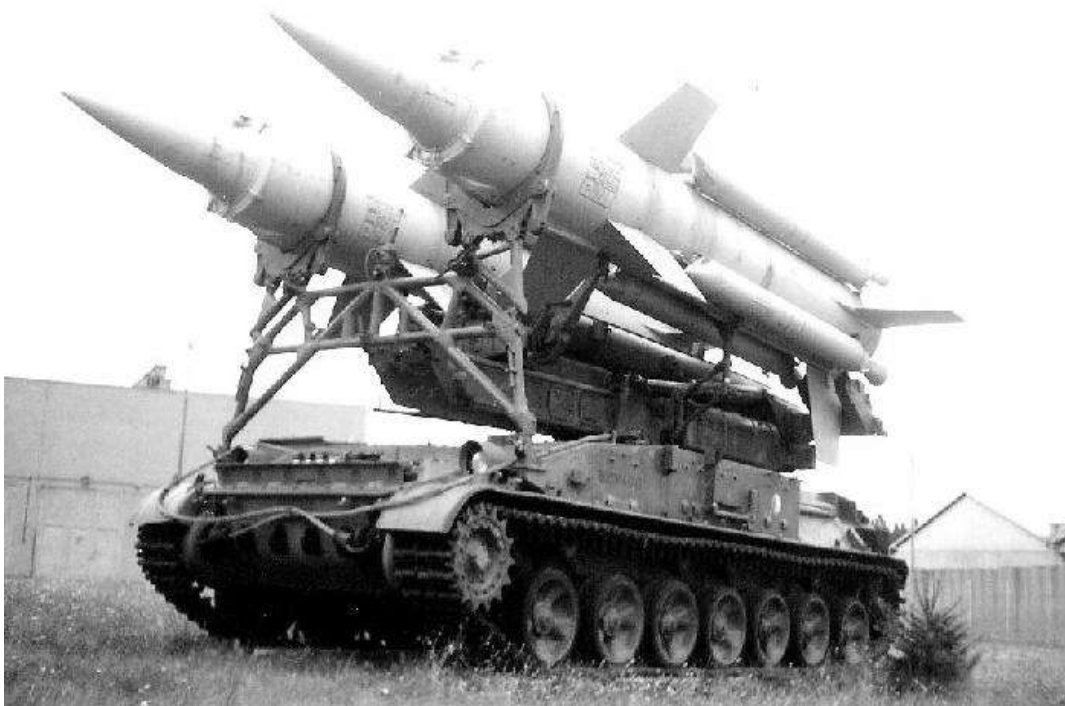
Odpalovací zařízení 2P-24 protiletadlového raketového komplexu KRUG v pochodové poloze

Po pěti měsících jsme se naučili zvládnout technicky základní prvky na úrovni baterie a prakticky je obsluhovat. Samozřejmě, díky povinnému samostatnému studiu do večerních hodin a výuce o sobotách.