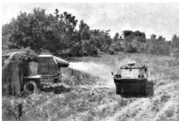
Průjezdni MSO s použitím teplovzdušného zařízení TZ-74

Je pravda, že byly nejlépe vycvičeny samostatné chemické útvary v přímé podřízenosti velitelů armády a okruhů. U divizí byly chemické prapory a roty přetěžovány dozorcí, strážní službou a odvelováním, čímž trpěl především jejich odborný výcvik. Proto se pro náročnou a nebezpečnou práci, kterou s sebou neslo používání skutečných RL jodu J-32 a OL yperit, sarin, tabun a difosgen, vyrobených pro tento účel v chemickém vojenském výrobním závodě, vybudovala chemická cvičiště ve VVP Tisá, Hradiště, Boletice, Dobrá Voda, Zadní Mostek a na Slovensku v Zemianských Kostolanech.