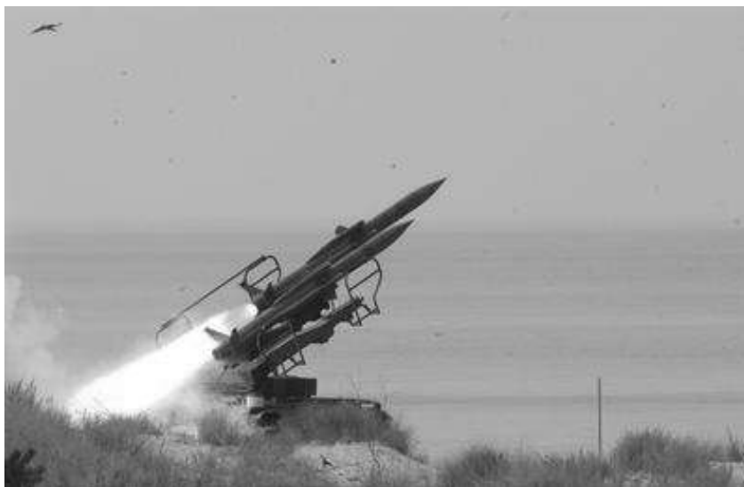
Odpálení protiletadlové řízené střely KUB