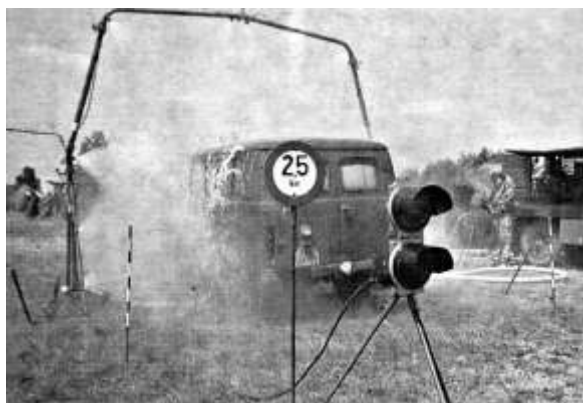
Průjezdni MSO s použitím odmořovacího rámu

Chemici také organizovali a materiálně zabezpečovali v rámci psychologické přípravy vojáků výcvik na cvičištích s použitím zápalných látek. Tato cvičiště byla k tomuto účelu speciálně vybudována a výcvik vyžadoval vysokou kázeň a organizovanost. Především vševojskoví velitelé se tohoto úkolu zhostili dobře a dosahovali dobrých výsledků.