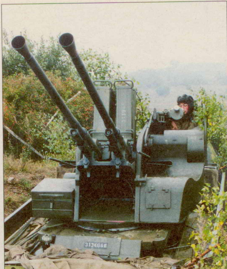
Podíl jednotlivých oblastí výzbroje na celkových nákladech na přezbrojení AČR v rámci jejího akvizičního plánu na léta 1995–2005

Tyto obecné cíle byly MO konkrétně rozpracovány do programů jejich dosažení tak, aby každý útvar věděl, co se od něho očekává. Velitelé útvarů by pak na základě stanovených úkolů měli formulovat své požadavky na personální obsazení, finance i techniku. Vzhledem k tomu, že se PPBS teprve zavádí, musely být «náklady» na rok 1995 pouze odhadnuty. Až s přechodem na