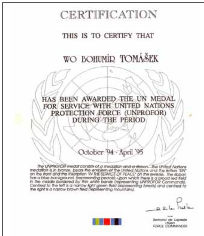
K účastnické medaili OSN „In the Service of Peace“ patří i tento anglicky psaný diplom.

Účastnická medaile OSN za službu v misi UNPROFOR, jejíž modrou stuhu doplňují zleva doprava zelený, červený a hnědý svislý pruh. Zatímco modrá barva zde tradičně symbolizuje OSN, zelená lesy a hnědá hory, červený středový pruh, ohraničený po stranách bílou linkou, měl symbolizovat „chráněné oblasti“ (UNPA) pod ochranou OSN.