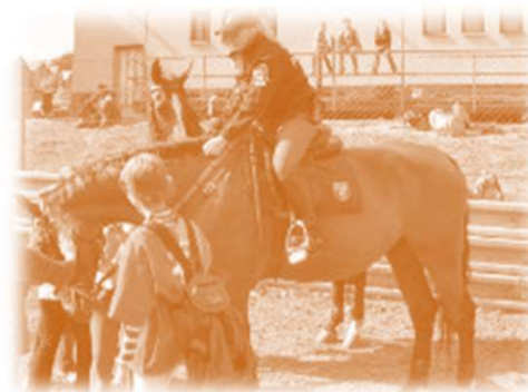
Jízdní jednotka (pouze do r. 2005)