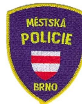
Rukávová nášivka /u každé obce jiná/