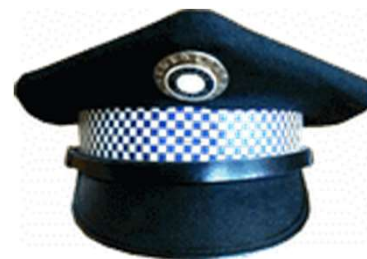
Šachovnice na pokrývce hlavy