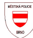
1992 – 1993