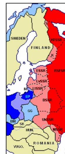
Mapa 1: Sféry vlivu podle dodatku