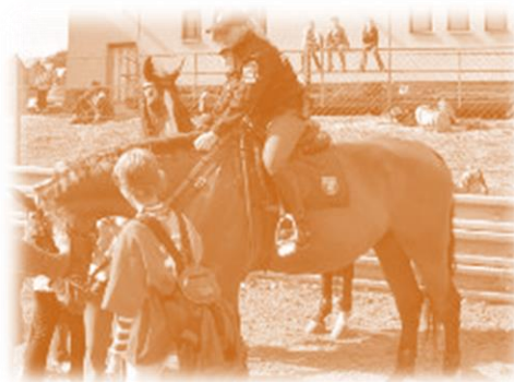
Jízdní jednotka (pouze do r. 2005)