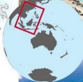
Čínská plavidla na útesu Mischief, náležícím ke sporným Spratlyho ostrovům, navrší písek a zvětšují tak jeho rozlohu