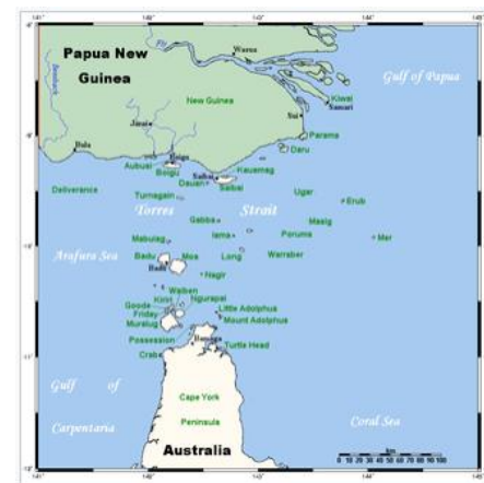
Mapa Torresova průlivu