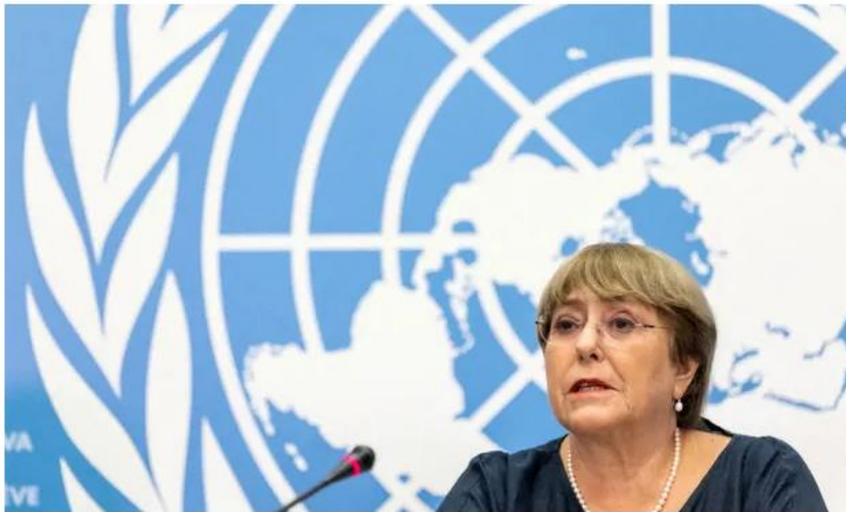
📷 The UN report, much of it based on Chinese official information, was written by the outgoing human rights commissioner, Michelle Bachelet.

Result not to debate its own damning report shows many states are unwilling to take sides in power struggle between China and west