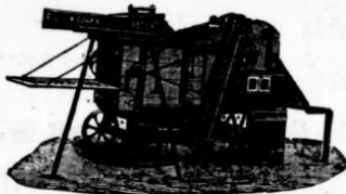
Nejnovější čistící žentourová mlátička