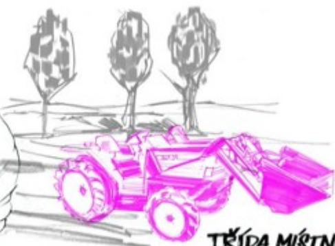
TRÍDA MÍSTNÍCH VAZEB