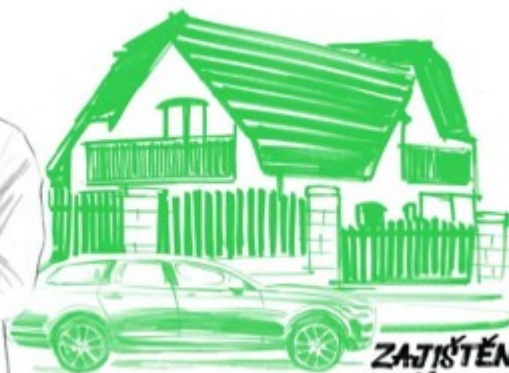
ZAJIŠTĚNÁ STŘEDNÍ TRÍDA