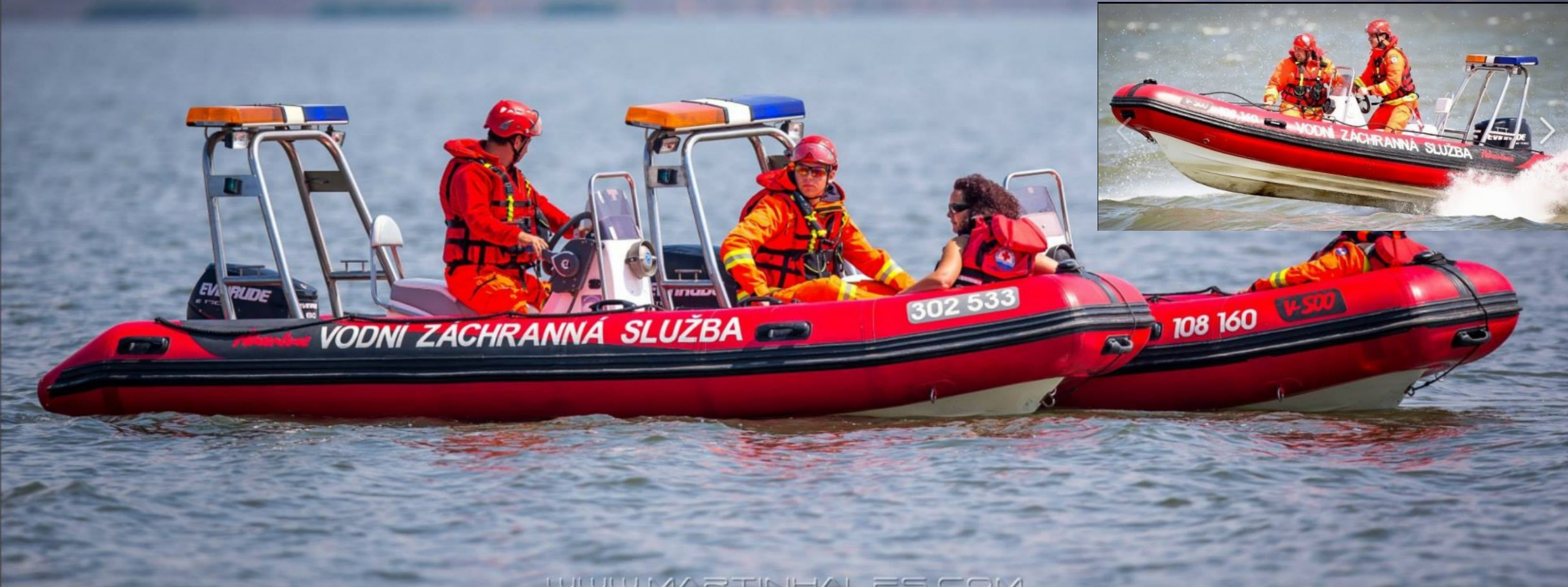
Motorový člun Adventure Vesta V-500 a V-550