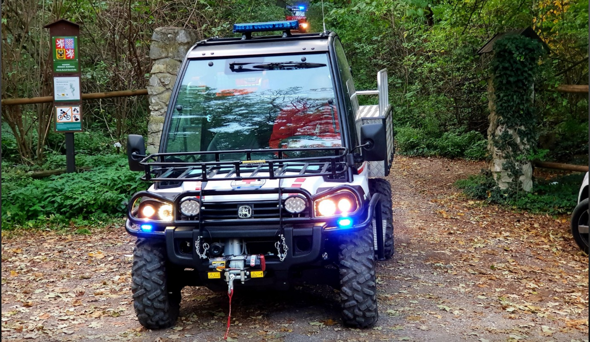
John Deere Gator