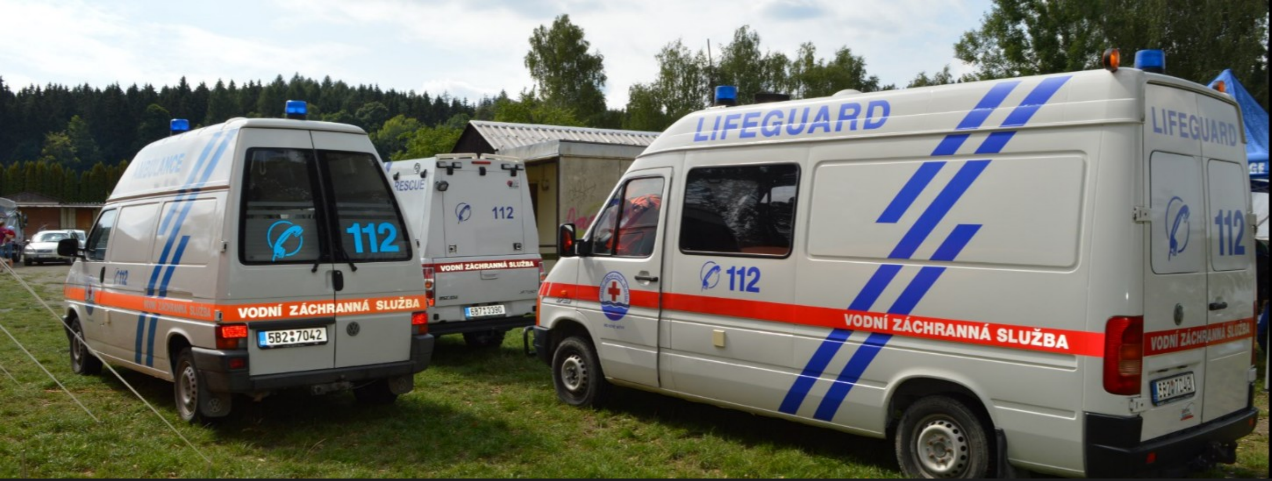
Technický automobil Volkswagen LT