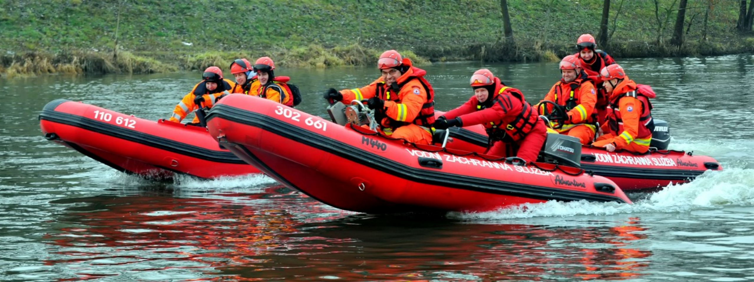
Motorový člun Adventure Master M440 a M470