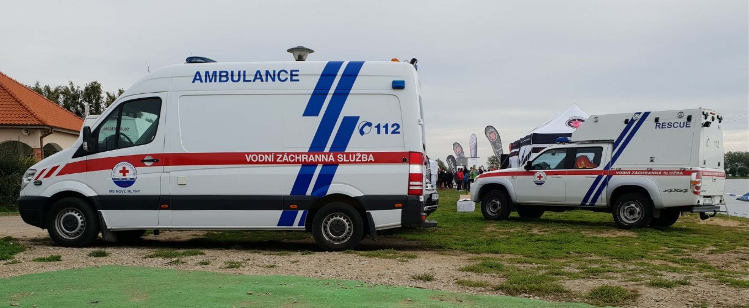
Sanitní automobil Mercedes Benz