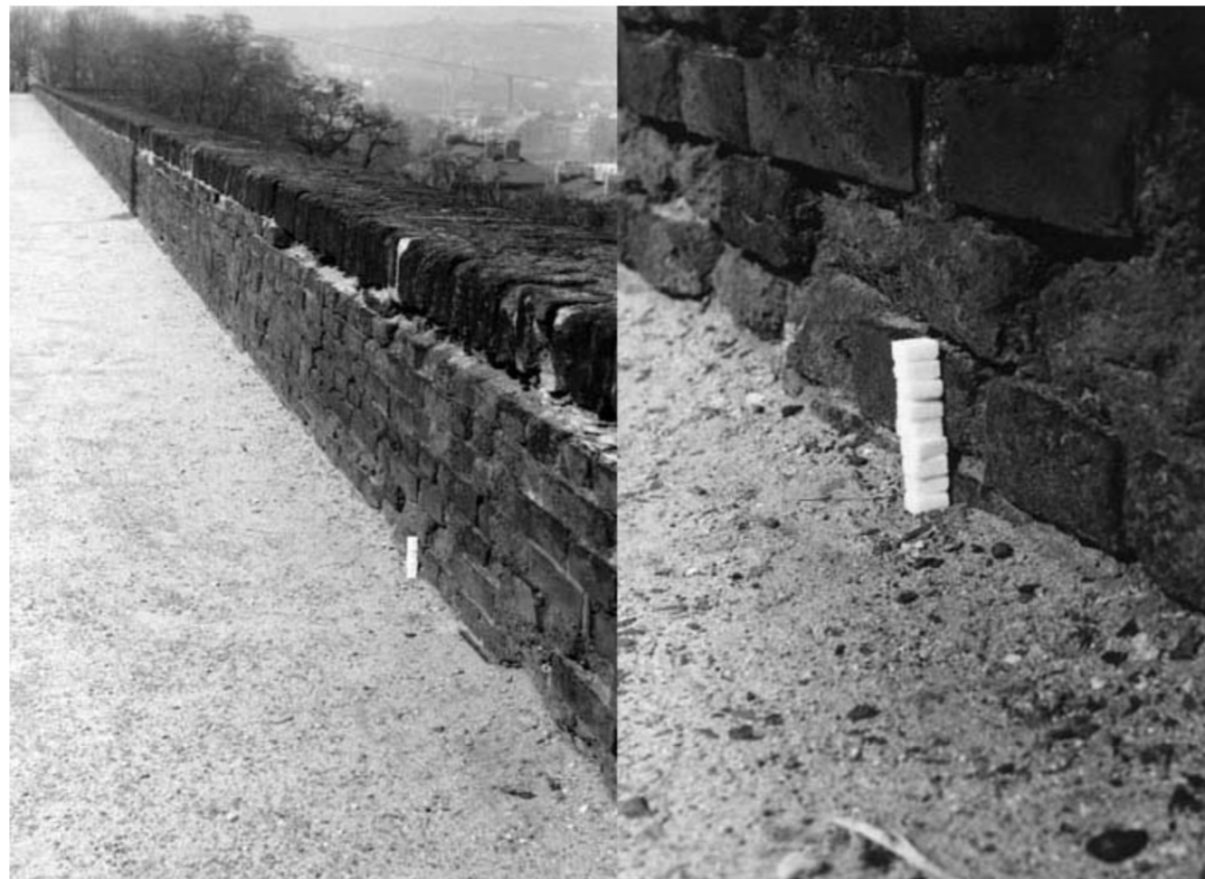
Věž z cukru, jaro 1981, Praha / Sugar Tower, spring 1981, Prague