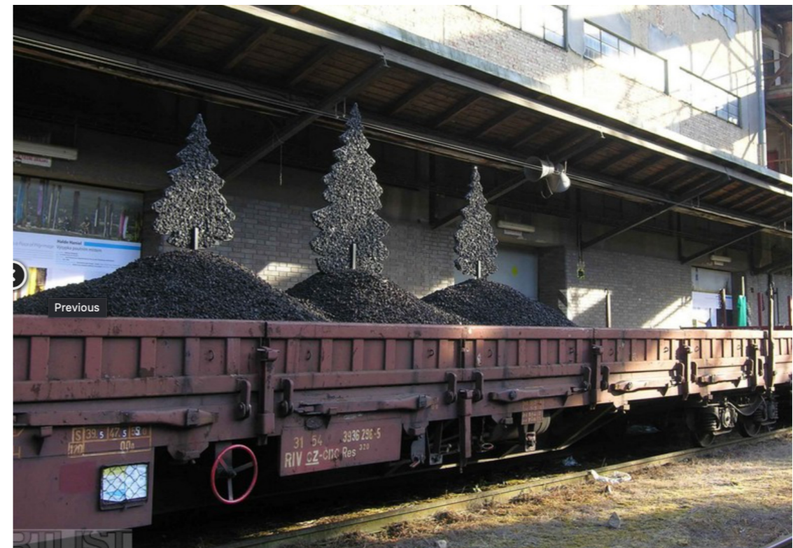
Revitalizace, landscape festival, 2014