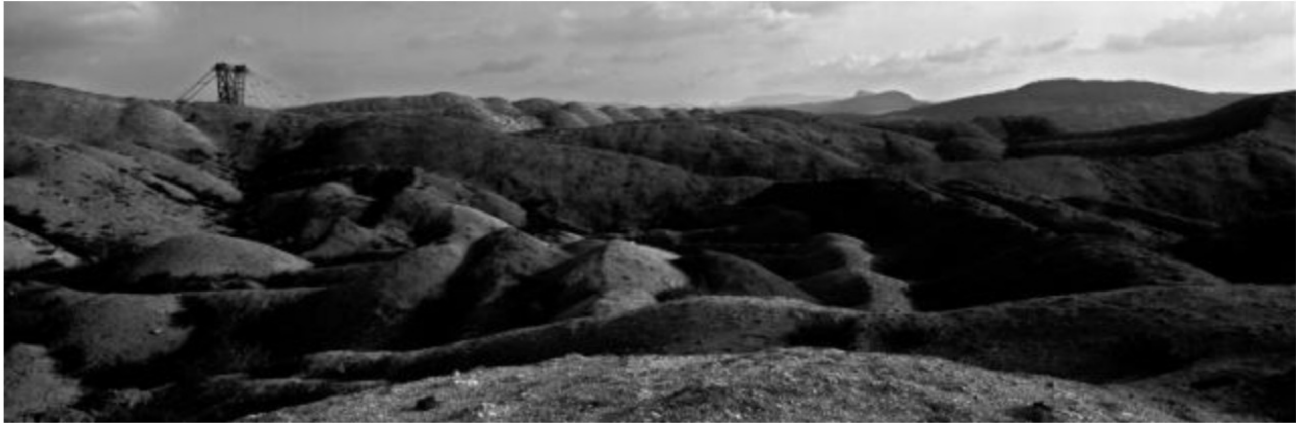
Region of the Black Triangle (Ore Mountains). 1992. Coal mining.