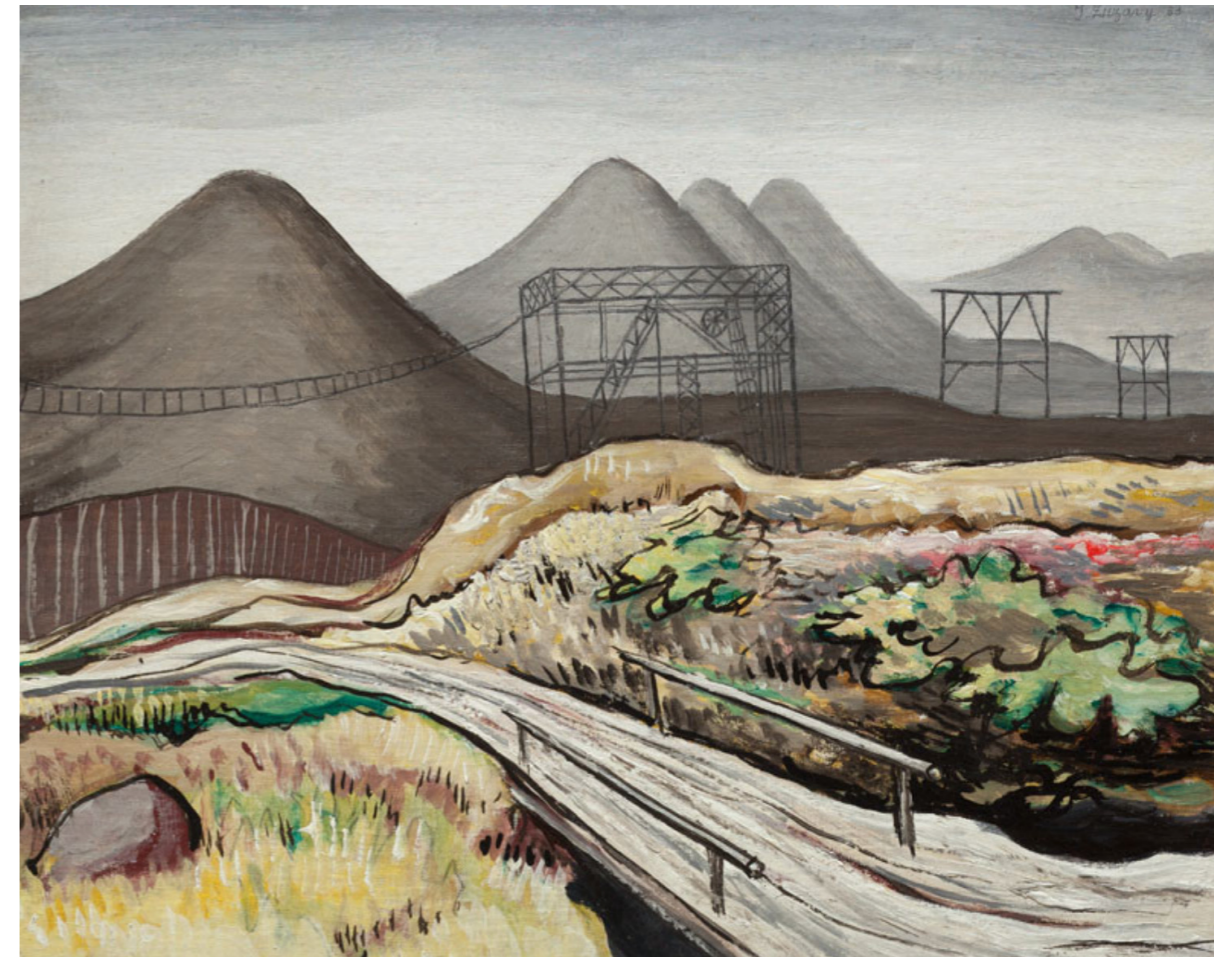
Jan Zrzavý, Ostravské haldy, 1933