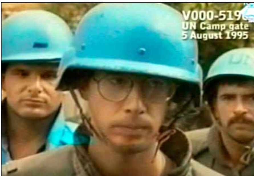
V sobotu 5. srpna 1995 vstoupili do Kninu chorvatští vojáci, na snímku dole vyčerpaný a pobouřený náčelník štábu Sektoru JIH mírových sil OSN kanadský plk. Andrew Leslie.

útok jako „synchronizovaný a kontinuální“ se zaměřením na celé město! Palba trvala až do setmění. Druhý den ráno byla obnovena ve stejné intenzitě a trvala až do vstupu chorvatských sil do města, k němuž došlo zhruba v 11 hodin dopoledne 5. srpna 1995. Během 27 hodin dopadlo do prostoru Knina přes 2000 dělostřeleckých granátů. Jeden z nich dopadl 300 metrů od stanoviště generála Foranda a zabil sedm srbských civilistů a tři další vážně zranil. 39