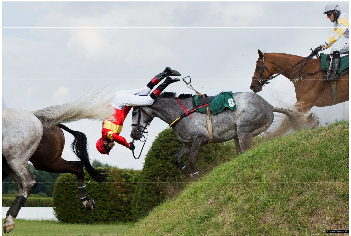
2016, Roman Vondrouš, ČTK