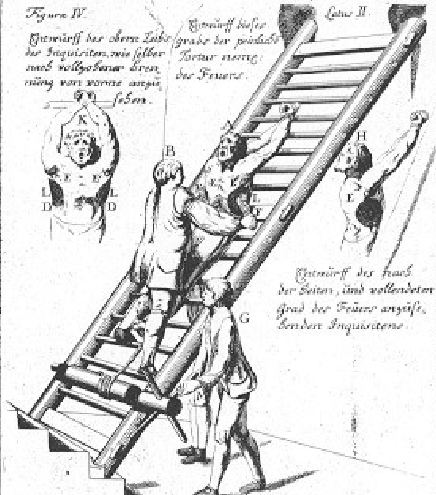
Erklärung der Buchstaben.

Entwurf dieses Grabs der nöthigsten Person vor der Feuer.