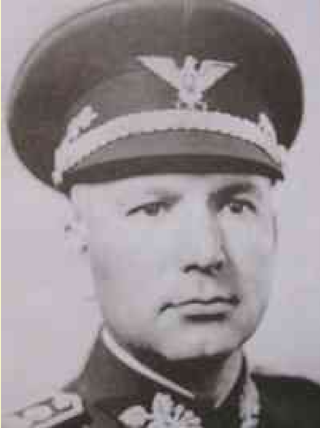
Generál Ferdinand Čatloš