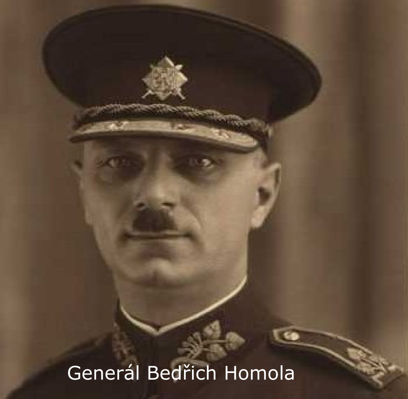
Generál Bedřich Homola