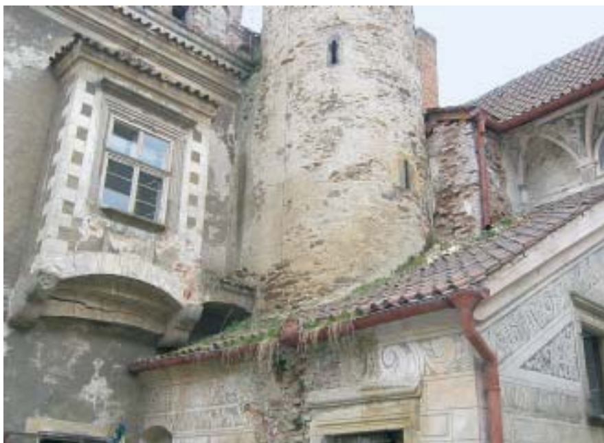
Poničené budovy arcibiskupského zámku v Červené Řečici.

Od počátku 90. let 20. století obecně platí, že systémovým nástrojem řešení majetkových křivd z doby nesvobody je metoda obecných restitučních zákonů. Již od počátku obnovování soukromého vlastnictví a úsilí o nápravu některých křivd z doby před rokem 1990 byla přislíbena vedle restitucí majetku fyzických osob, politických stran a spolků také systémová náprava majetkových křivd způsobených církvím a náboženským společenstvem. Tento záměr měl od počátku podporu napříč politickým spektrem a odrážel v sobě rovný přístup k různým subjektům, kterým byly majetkové křivdy způsobeny.