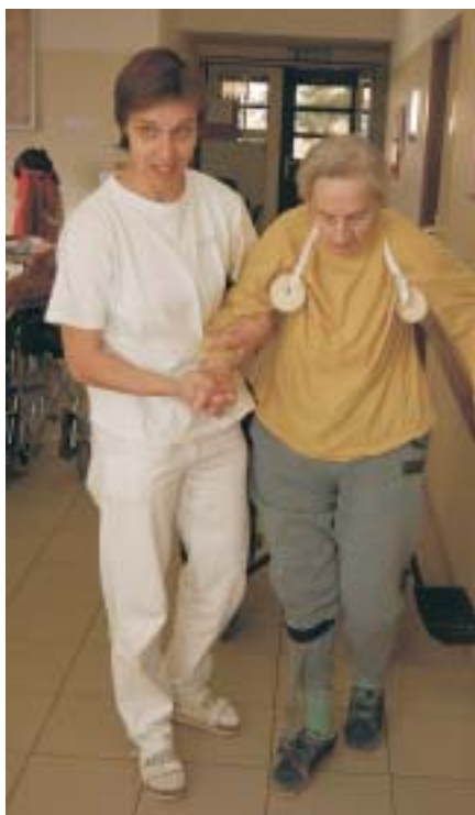
Terapie klientů v Léčebném a rehabilitačním středisku Chvaly – Horní Počernice, zřizovatel Církev bratrská.

subjektům stejně. Vždy jde o financování určitých veřejně prospěšných činností, a to zásadně bez ohledu na to, kdo je provádí nebo vlastní. Každý vlastník kulturní památky tedy dostane příspěvek na její údržbu podle zákonem stanovených podmínek. Každá škola dostane příspěvek na žáka. Každá nemocnice dostane proplacenou poskytnutou péči podle stanovených pravidel. Církev a náboženské společnosti tedy nemají, a ani nechtějí mít, žádná privilegia. Na druhou stranu by bylo asi nesmyslné diskriminovat financování určitých památek z důvodů, že je vlastní církev. Tento argument je tudíž nejenom lichý, ale také vůbec nepatří do diskuse o majetkovém narovnání mezi státem a církvemi.