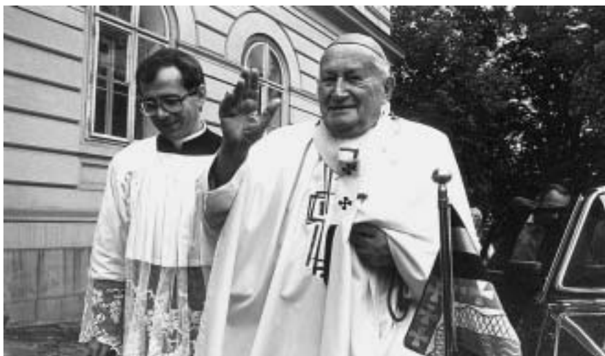
Kardinál František Tomášek, 1989.

Po 17. listopadu 1989 byl v naší zemi zahájen proces obnovy náboženské svobody. Ve vztahu k církvím a náboženským společnostem došlo ke zrušení trestních norem zaměřených proti věřícím občanům a duchovním. Ústavněprávní garance individuální i kolektivní náboženské svobody poskytl Listina základních práv a svobod doprovázená rozhodovací praxí Ústavního soudu. Došlo k přijetí zákona č. 308/1991 Sb., o svobodě náboženské víry a postavení církví a náboženských společností, který v právním řádu obnovil předpoklady vnitřní autonomie církví a náboženských společností a jejich veřejného působení ve společnosti. Tento zákon byl později nahrazen zákonem č. 3/2002 Sb., o církvích a náboženských společnostech.