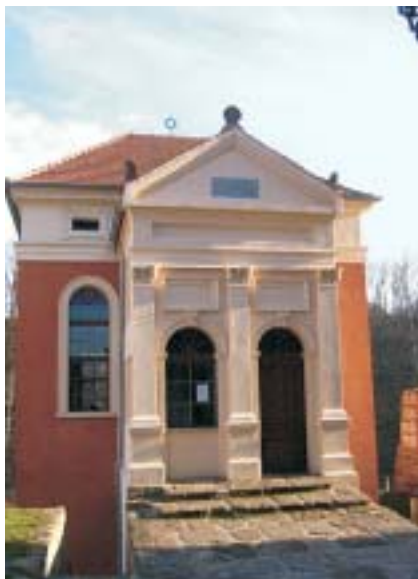
Stav před a po opravě barokní synagogy v Ústěku.

dané církve nebo náboženské společnosti. Tato okolnost názorně dokládá, že náboženskou svobodu a vnitřní autonomii církví a náboženských společností, obnovenou po roce 1989 a zaručenou čl. 16 odst. 2 Listiny, je nezbytné dovršit také v její ekonomické rovině.