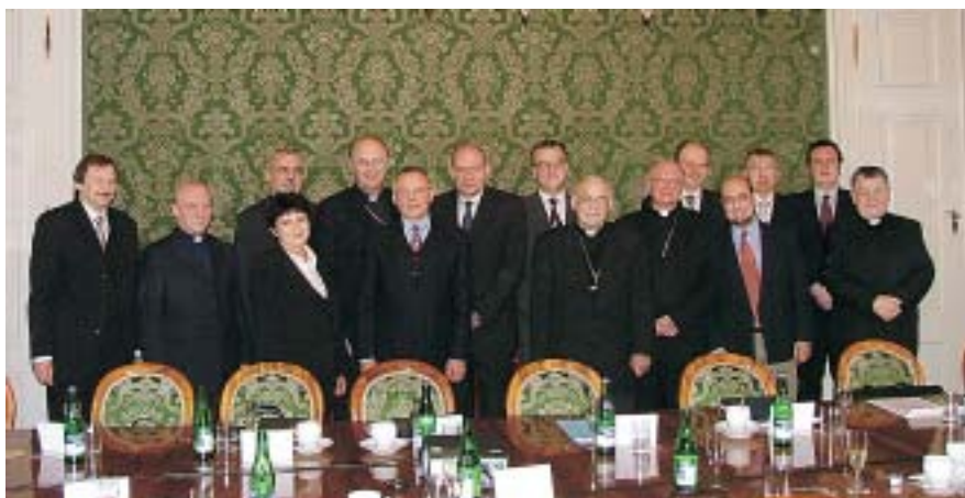
Jednání představitelů státu a církví a náboženských společností.

Návrh zákona představuje pro stát výhodný kompromis. Církve a náboženské společnosti ustoupily z celé řady svých požadavků. V jejich případě se tedy nejedná o úplnou restituci a úplné odškodnění. I proto název zákona mluví o „zmírnění některých majetkových křivd“. Náhrada navíc nezohledňuje škody způsobené na majetku, ani nevypovídá výnosy, které