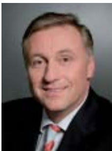
Mirek Topolánek, předseda vlády

Co přesně má být vráceno? Jakým způsobem? Jak bude vypadat vztah církví a náboženských společností a státu? Na tyto a další otázky jasně a stručně odpovíme v následujícím textu.