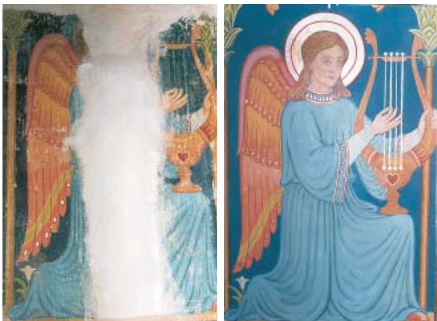
Anděl před a po opravě v klášteře sv. Karla Boromejského v Praze – Řepich.

středisek. Od července do září 1950 proběhla taková akce rovněž proti klášterům ženských řeholí. Kláštery se poté změnilly na kasárna či sklady. V roce 1950 došlo k násilnému a úplnému zákazu Řeckokatolické církve.