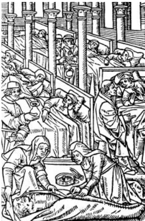
Péče o živé a mrtvého v řádovém špitále (dřevořez, kolem 1500).

Od počátku utváření pojmu vlastnické právo v občanském právu nebyly pochybnosti o tom, že církevní majetek patří mezi majetek soukromý. Církev a náboženské společnosti (jejich instituce) měly zásadní oprávnění jako ostatní vlastníci tento majetek držet, užívat, brát z něho užitky a dále převádět. To platilo už od prvního občanského zákoníku na našem území, který byl přijat v roce 1811 a platil až do svého zrušení v roce 1950. Všechny majetek církví a náboženských společností byl tedy fakticky a právně v je-