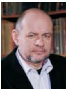
Václav Jehlička, ministr kultury