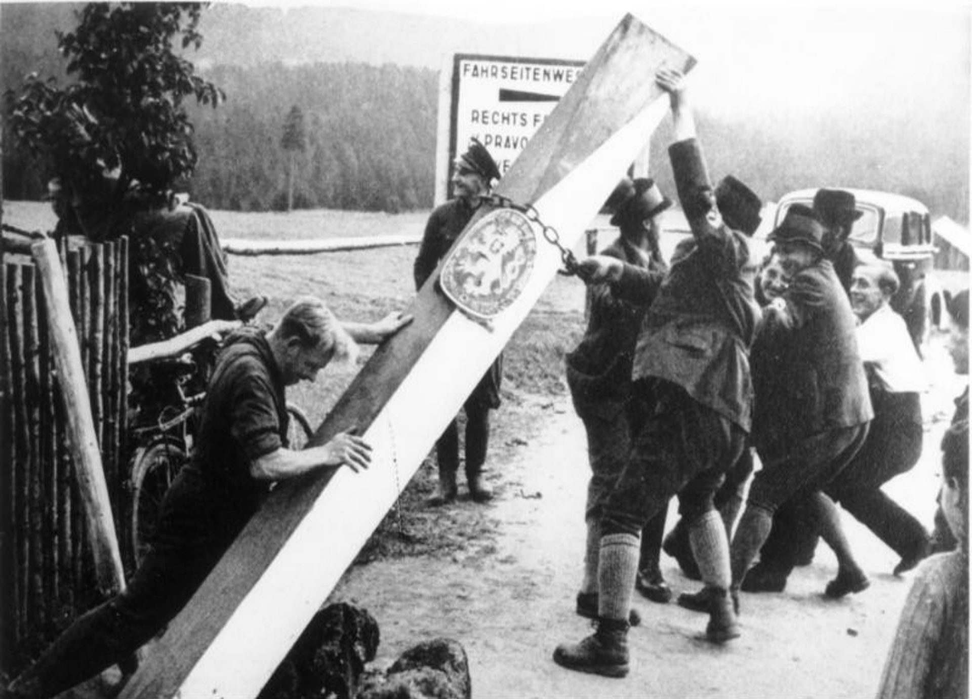
1938 September - Oktober