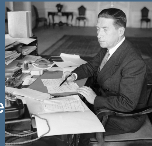
Prokop Drtina (tajemník kanceláře prezidenta republiky)