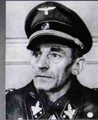
SS-Obergruppenführer Karl Hermann FRANK 24. 1. 1898 – 22. 5. 1946

Rodák z Karlových Varů, původním povoláním knihkupec. Od roku 1933 jeden z vedoucích činitelů Sudetoněmecké strany (SdP) Konráda Henleina. V letech 1935-38 poslanec čs. parlamentu za SdP. V roce 1938 se aktivně podílel na rozbití Československa. Po Mnichovu zástupce gauleitera nově vzniklé župy Sudetengau. Od 19. 3. 1939 státní tajemník u říšského protektora pro Čechy a Moravu, od 20. 3. 1943 říšský státní ministr a generál policie v Protektorátu Čechy a Morava. Osobně zodpovídal za represálie nacistů vůči českému obyvatelstvu (akce proti vysokoškolským studentům 17. 11. 1939, popravy za druhého stanného práva, vyhlazení Lidic 10. 6. 1942). V květnu 1945 se mu podařilo uprchnout z Prahy do západních Čech, kde byl zajat americkou armádou a následně vydán zpátky do Československa. V květnu 1946 byl čs. lidovým soudem v Praze odsouzen za válečné zločiny proti obyvatelům republiky k trestu smrti. Byl popraven ve věznici v Praze na Pankráci.