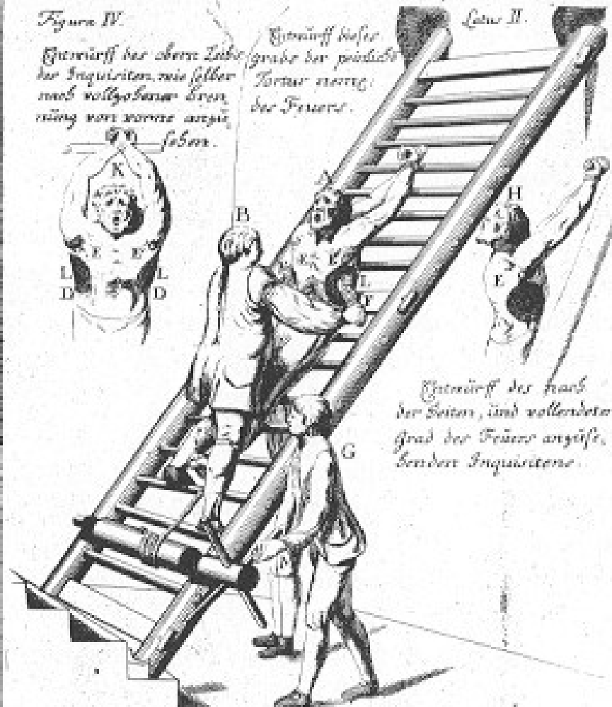
Erklärung der Buchstaben.

Entwurf dieses Grabs der nöthigsten Personen.