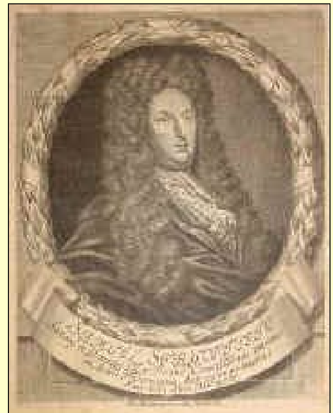
Samuel Stryk (1640 - 1710)