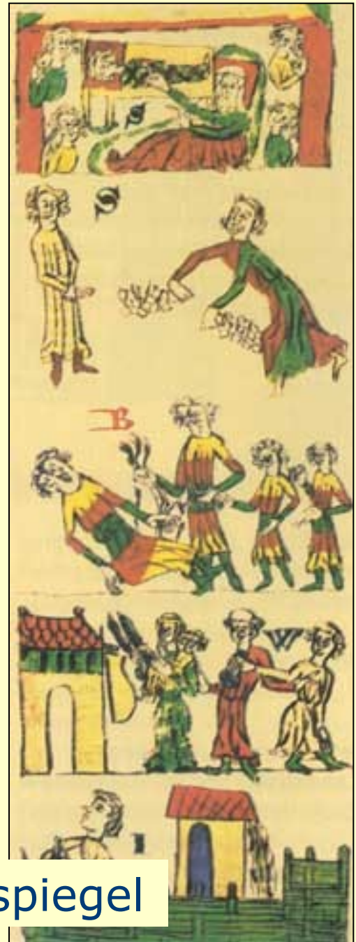
Sachsenspiegel a Schwabenspiegel

wei swert her got in er- richteu becheimunt an erbeuht- dem pabste Das geseitche dem herzer Das werliche. Ad em pabste je gese ce zu richte an becheimunt arif uf d nem blandin pherde-vnce der her ser sal yin an freyreif halbin das der facti nicht wanne- dis e becheim- was dem pabste wider se- das he nur geseitche gerichte nicht becheim- gen mac- das is der herzer mit wer- lichen richte nunge de pabste geseitche zu sine- id sal in geseitche gewalt heit dem werliche gerichte ab je becheim- S in idich erliche man je pheliche mit an suchene erliche- in dem iant- fur he zu sine richte komeu is in dem lichte- do he tunc geseitche is- verliche je abir erliche- S chepliche- mit in d becheim- seir suchu- S chepliche- d- tuncpabste komeu der erliche- zu glair wie sulu si werliche- gerichte suchu- S chepliche- des geseitche- dunge- schen wochu- vnc- komeu- banne- je gir- mit abir- ein- dunge- ve- vunc- vunc- je- von- geseitche- dunge- vnc- vnc- das- sulu- si- suchu- in- pheliche- dunge- gerichte- gerichte- werte- in- mit- haben- si- vor- wiste- je- richte- lant- er- richte- dunge- is- je-