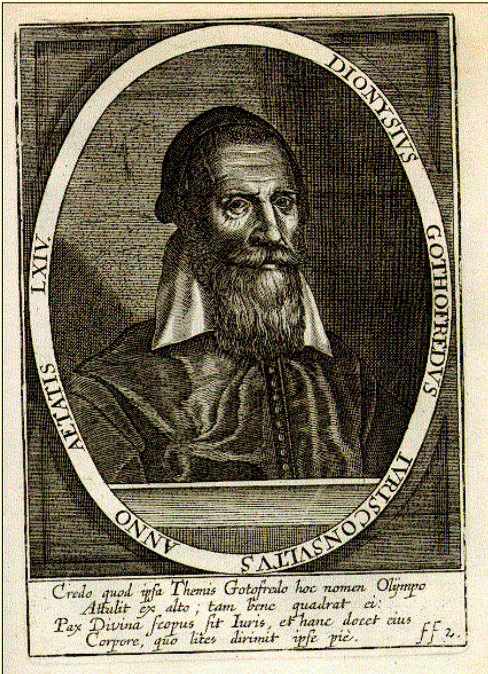
Dionysius Gothofredus (Godefroy, Denis) (1549-1622)