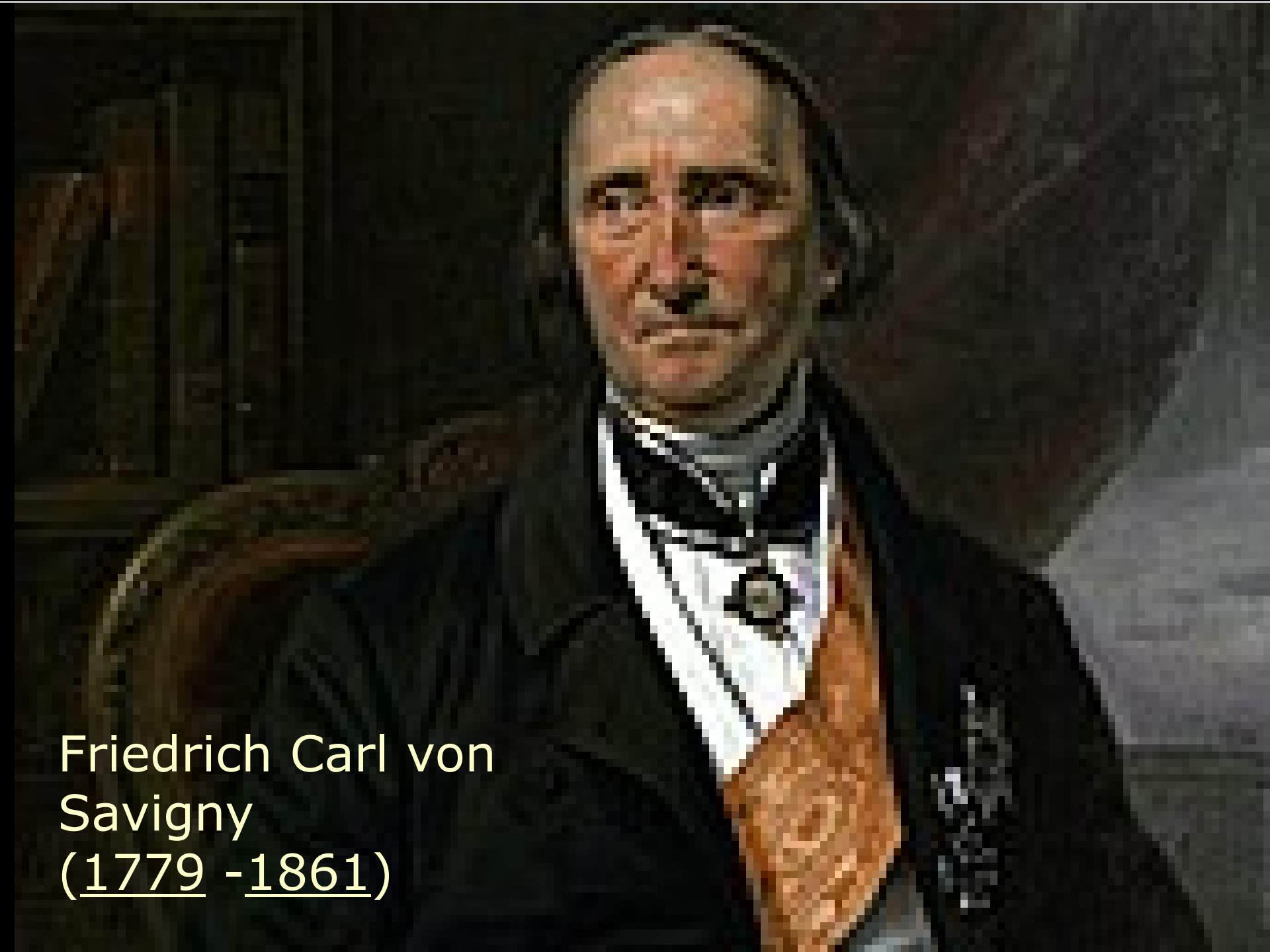
Friedrich Carl von Savigny ( 1779 - 1861 )