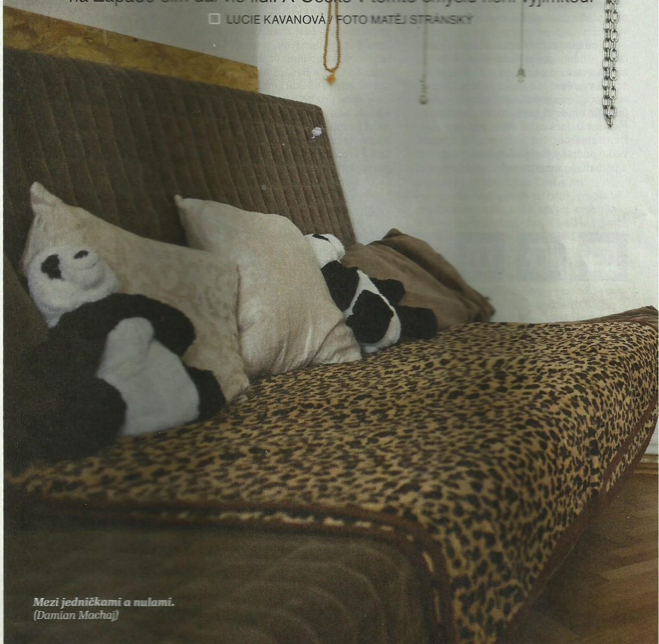
Mezi jedničkami a nulami. (Damian Machaj)