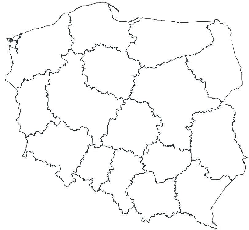
układ województw po reformie (od stycznia 1999 r.)