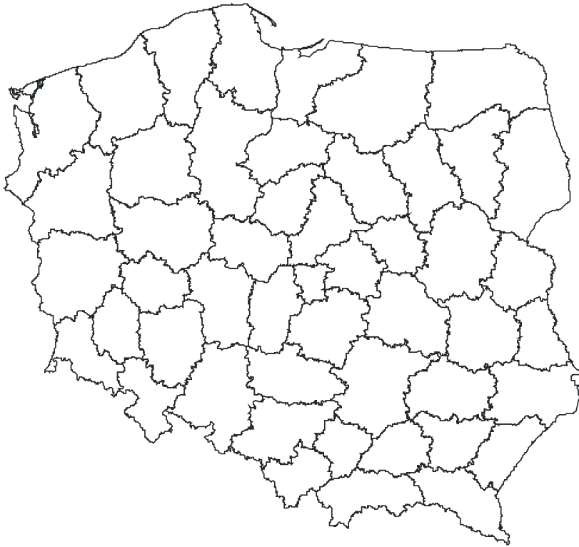
układ województw przed reformą (do końca 1998 r.)