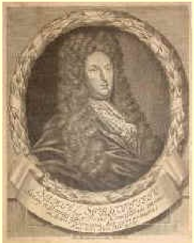
Samuel Stryk (1640 - 1710)