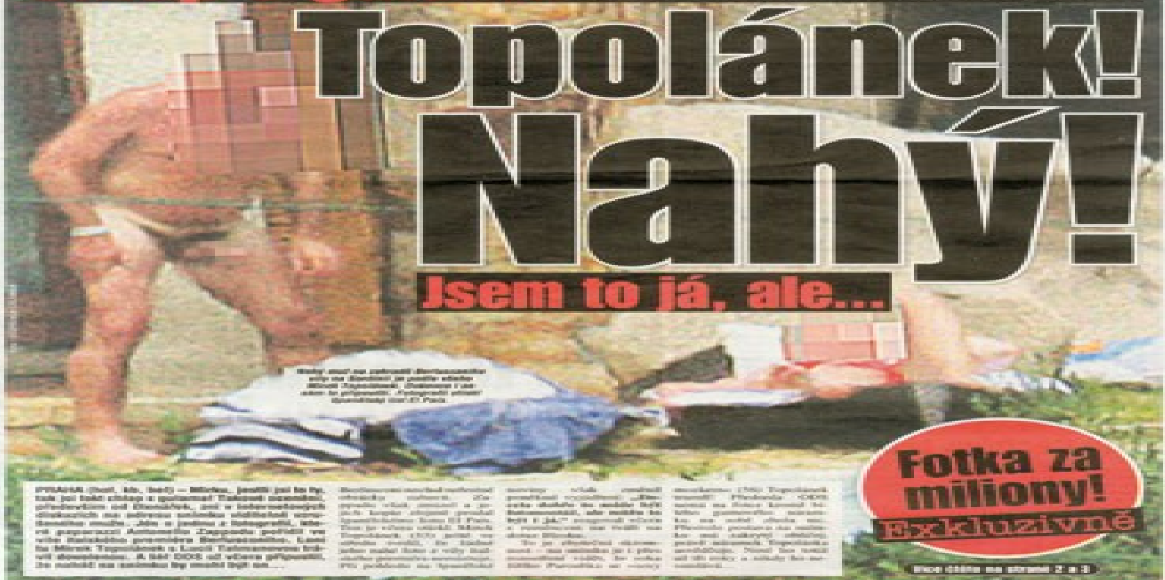
Prácičky se zúčastnil Berlusconiho... (Caption text is partially obscured and difficult to read fully)