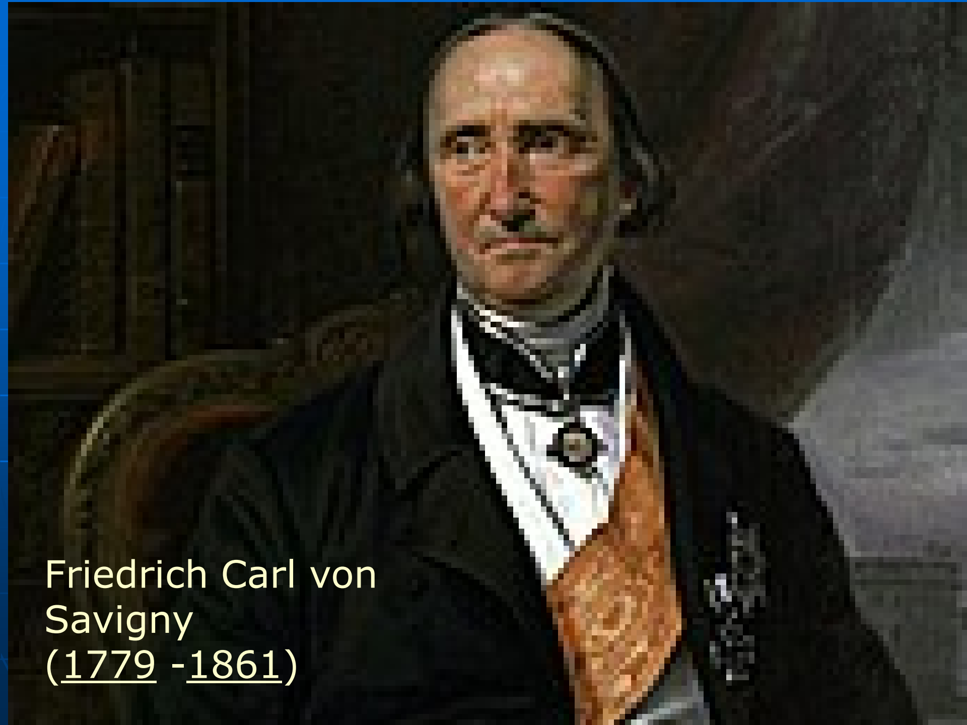
Friedrich Carl von Savigny ( 1779 - 1861 )