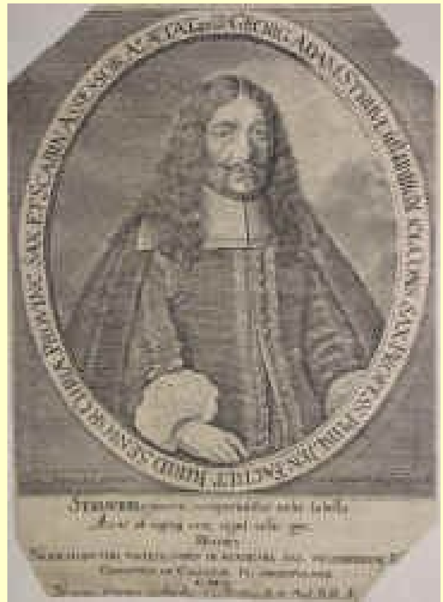
Georg Adam Struve