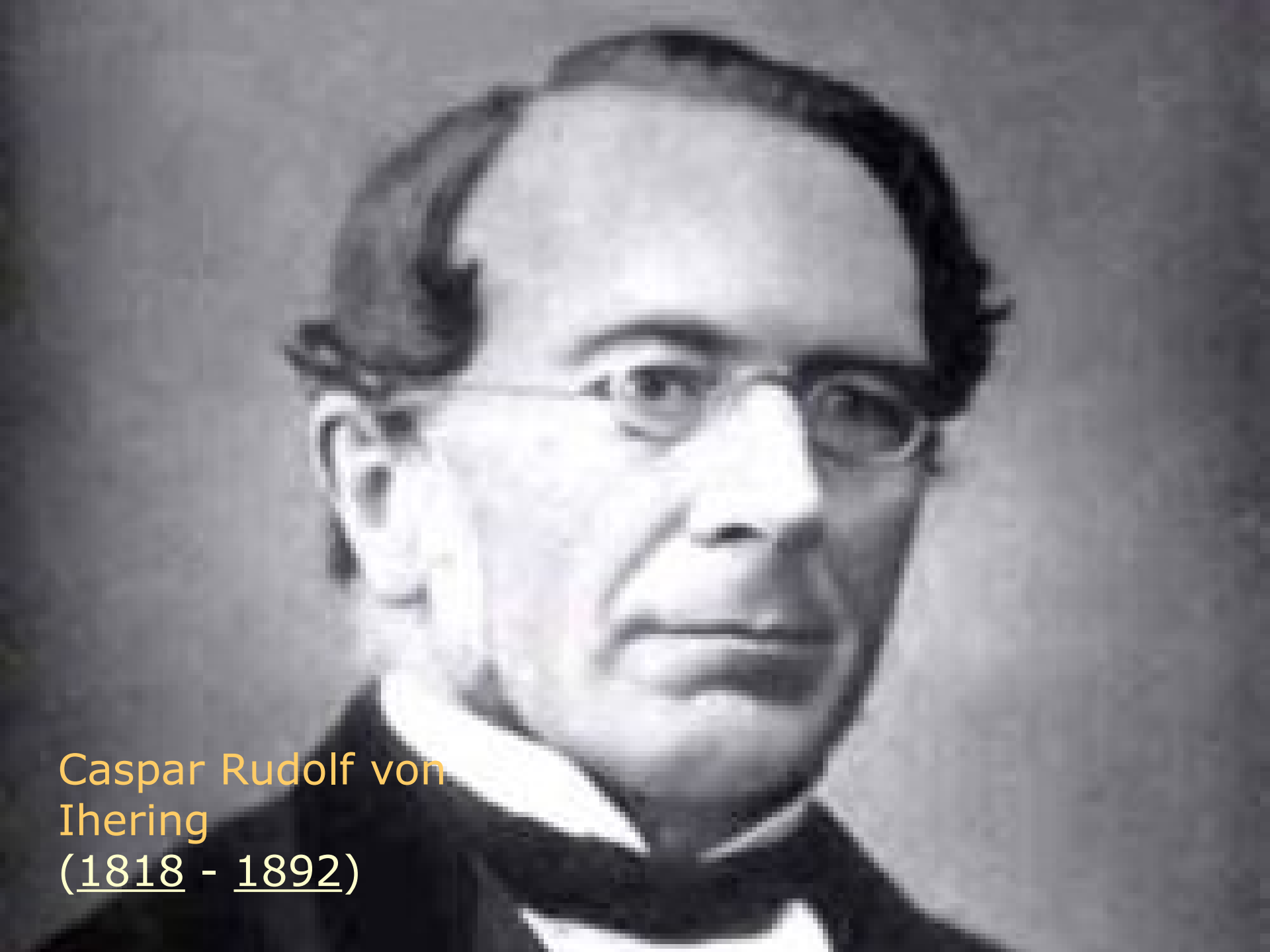
Caspar Rudolf von Ihering ( 1818 - 1892 )