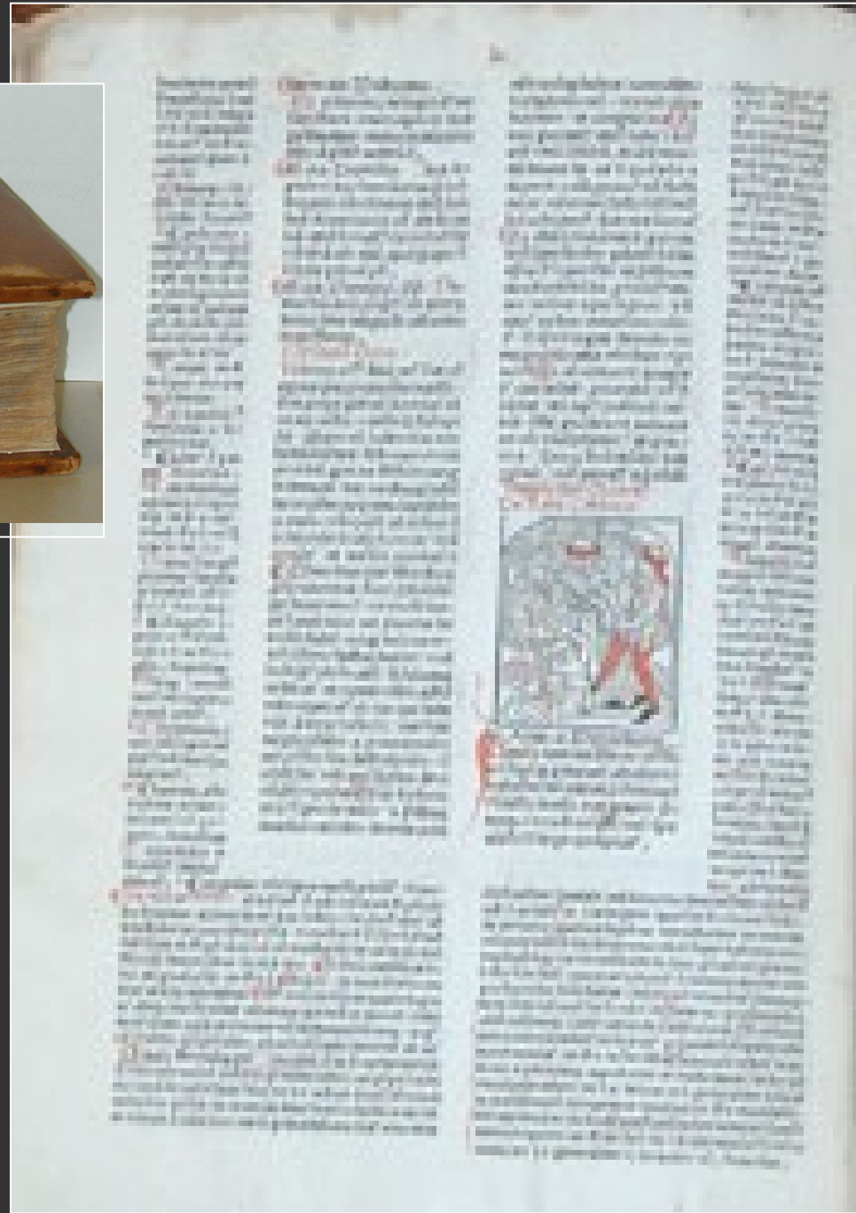
Corpus iuris Canonici